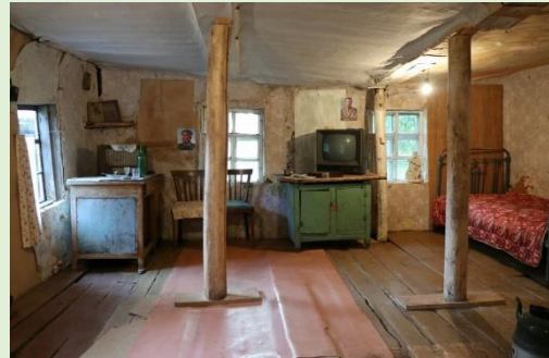
Дом-музей Довлатова в Пушкинских Горах

Дом-музей писателя Сергея Довлатова в Пушкинских Горах открылся 3 сентября 2011 года.