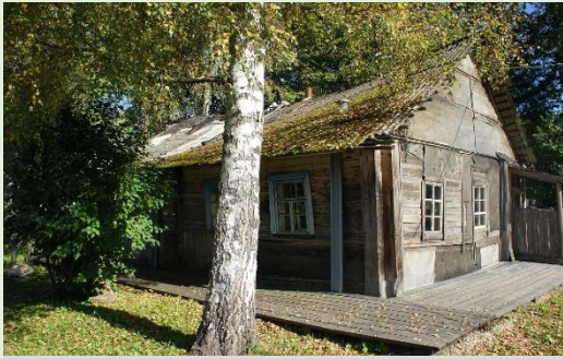
Дом-музей Довлатова в Пушкинских Горах