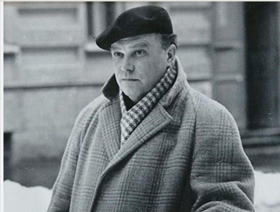
Умер Никита Евгеньевич Чарушин в 2000 году.

Разумеется, такое разнообразное и яркое творческое наследие не могло остаться незамеченным. На рисунки Никиты Чарушина обратили внимание японцы и выкупили его последнюю книгу. При жизни Никита Чарушин был награжден званиями «Народный художник России» и «Заслуженный художник Российской Федерации».