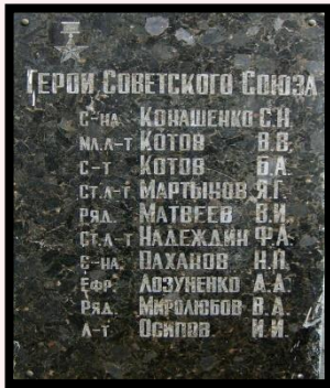
Братская могила с. Пекари. Похоронено более 5000 воинов, погибших при форсировании Днепра и в боях на плацдарме.