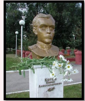
Аллея Героев. Липецкая область. Город Усмань.

Как считали фронтовые товарищи поэта, Борис Котов, словно предчувствуя свою гибель, написал эти строки: