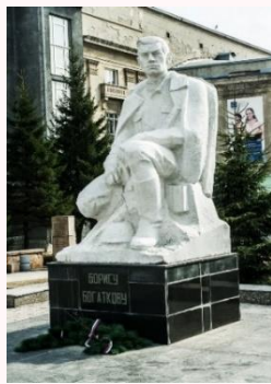
Памятник Борису Богаткову в Ачинске и Новосибирске