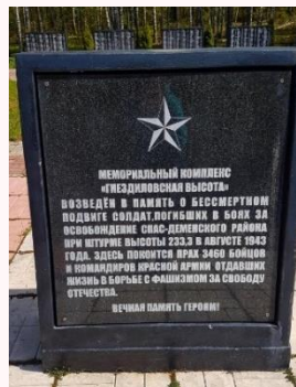
Мемориальный комплекс «Гнездиловская высота»