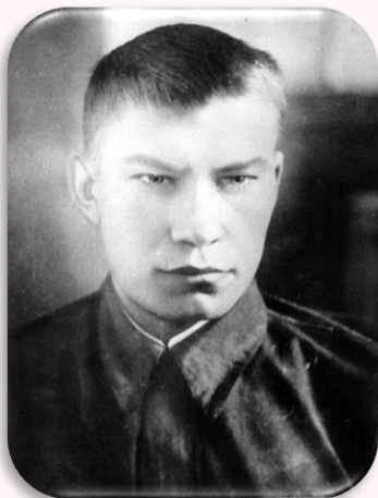
Борис Богатков, 1942 г.