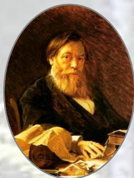
П. И. Мельников (Андрей Печерский) (1818–1883)

[Из последних докладных записок министру внутренних дел]. П. Мельников