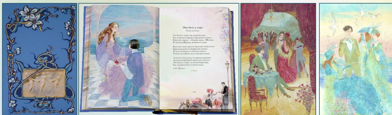
Обложка и иллюстрации Ю. Лучкиной и Т. Якуниной к сборнику «Ананасы в шампанском», изданному в 2014 г.

Такими строками открывается сборник поэта. Кто не слышал эти слова? А знаете ли вы, как они появились и как называется стихотворение? Так и хочется ответить «Ананасы в шампанском», но это будет ошибкой. Поэт назвал его совсем по-другому – «Увертюра». Написанное в январе 1915 года, оно впервые было опубликовано в сборнике «Ананасы в шампанском», изданном в Петрограде. А всеобщее заблуждение связано с тем, что стихотворение помещено в начале издания, а потому-то стало известно по названию сборника и запомнившейся фразе, повторяемой в тексте. Если вспомнить историю его создания, то по воспоминаниям литератора Вадима Баяна, будучи в гостях у него, Маяковский окунул кусок ананаса в шампанское, съел и посоветовал сделать то же сидевшему рядом Северянину. Тот сразу же сочинил первую строфу будущего стихотворения, вошедшего в цикл «Розирис».