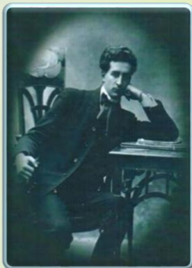
Игорь Северянин (1887–1941)

Ананасы в шампанском! Ананасы в шампанском! Из Москвы в Нагасаки! Из Нью-Йорка на Марс!» Увертюра. И. Северянин