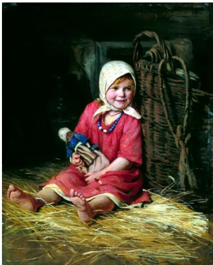
Карл Лемох. Варька. 1893 год