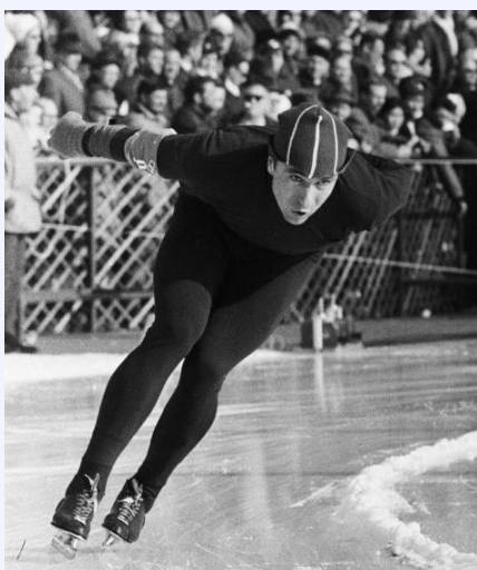
Е. Р. Гришин. Советский конькобежец и велогонщик, четырёхкратный олимпийский чемпион. Почётный гражданин города-героя Тулы