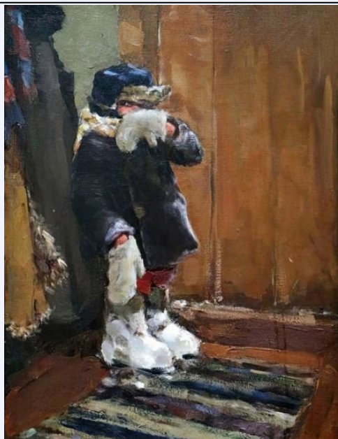
В. П. Козлов. Нагулялся. 1961 год

Хале/па. Ветренная или сырая погода с дождём или снегом. Куда ты собралась? Смотри, какая халепа на дворе – сиди дома. (д. Варваровка, Лен.).