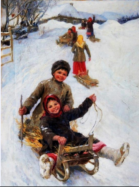
Ф. В. Сычков. Катание с горы зимой. 1902

При этом малыш полон впечатлений, энергии и хорошего настроения. Дом очень похож на деревенский, поэтому сейчас наш герой разденется и полезет греться на печку. Мама накормит его горячим супом, переоденет в сухую одежду и уложит спать. Вот только спать мальчик пока не захочет и будет просить бабушку рассказать ему сказку. Сразу вспоминается стихотворение Ивана Сурикова «Детство».