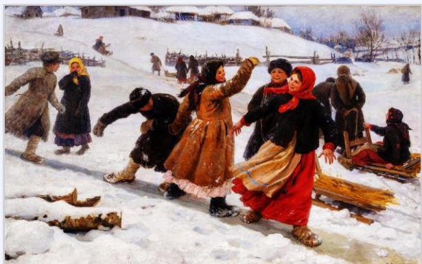
Ф. В. Сычков. С гор. 1910 год

Зима издавна была временем развлечений и забав на Руси: все сезонные полевые работы завершались, и появлялось больше свободного времени, поэтому молодёжь изобретала различные способы веселиться и радовать всех остальных.