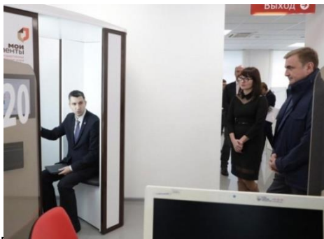
14 февраля Губернатор Тульской области Алексей Дюмин ознакомился с криптокабиной

В центрах оказания государственных и муниципальных услуг заработали первые криптокабины, позволяющие оформить биометрический загранпаспорт нового поколения, срок действия которых составляет 10 лет, в автоматизированном режиме, без посещения МВД.