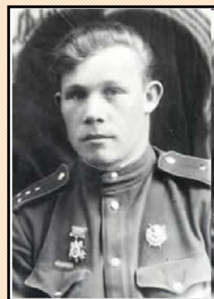
Летчик Ю. И. Горохов

И уже 28 июля 1943 года на аэродроме Кубинка под Москвой состоялось торжественное вручение самолета командиру 2-й эскадрильи 22-хлетнему капитану Юрию Ивановичу Горохову. Это был бесстрашный летчик, о нем много писала фронтовая газета «Сталинский пилот». Он лично сбил 8 вражеских самолетов. Юрий был не только мастером воздушного боя, но и еще был страстным поклонником творчества А. С. Пушкина.