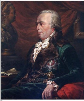
А. С. Васильчиков

Одно за другим поколения владельцев села находили последний приют свой под сводами усадебного храма. Здесь же был захоронен фаворит Екатерины II – Александр Семёнович Васильчиков.