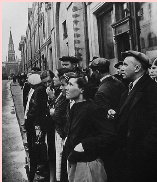
Первый день войны. 22 июня 1941 г.

И через всю страну струна Натянутая трепетала, Когда проклятая война И души и тела топтала.