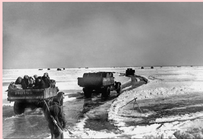
Грузовые автомобили вывозят людей из блокадного Ленинграда

В 1942–1943 годах Межиров воевал под Ленинградом в 1-м батальоне 864-го стрелкового полка 189-й стрелковой дивизии, которая в разное время входила в состав 42-й, 67-й и 55-й армий.