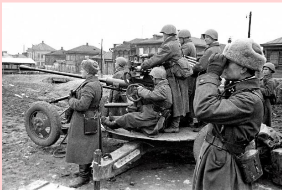
Советские зенитчики. Щёкино. Тульская область. 1941

Александра Межирова направили под Саратов в Татищево на курсы подготовки десантников. Оттуда он попал в 8-й парашютно-десантный корпус, который формировался для отправки на фронт. Но прыгать с парашютом не довелось, когда немцы вышли к Туле, весь корпус погрузили в транспортные самолёты и отправили на помощь пехотинцам. В бою Александр был ранен осколками мин в обе ноги. В госпитале переболел тифом.