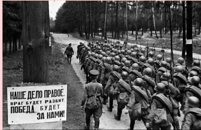
Советские пехотинцы выдвигаются на фронт, 23 июня 1941 года.

Паровозы кричали В голос на Окружной. Мама в печали Прощалась со мной.