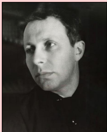
Поэт Александр Межиров. 1964 год.

Вернувшись в Москву, Александр Петрович посещал исторический факультет МГУ, прослушав там полный курс в качестве вольнослушателя, и одновременно учился в Литературном институте им. А. М. Горького. В различных справочниках приводятся разные сведения об образовании поэта.