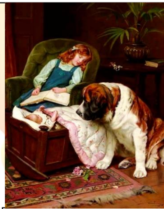
Артур Джон Элсли. Няньки.