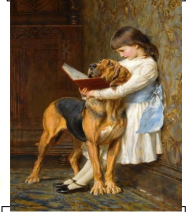
Брайтон Ривьер. Принудительное образование.

Литература о животных – это отдельная тема. Даже реальное знакомство с животным миром не будет таким полным, как прочтение книги. Дело в том, что, общаясь с животными, мы наблюдаем лишь часть их реакций, книга же повествует о реальных событиях и объясняет поведение животных, их повадки. Многие знаменитые писатели были страстными собачниками, а их преданные четвероногие друзья навеки вошли в историю. Не случайно собаки появлялись и продолжают появляться во многих литературных произведениях.