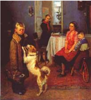
Фёдор Решетников. Опять двойка.

В искусстве животные нередко изображались как на полотнах, так и в скульптуре. Картины с изображением собак играют важную роль в развитии искусства. С их помощью художники могли предавать атмосферу тепла и уюта, благополучия и достатка, движения и скорости. Недаром эти животные так долго идут с нами рядом.