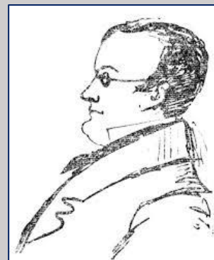
Дельвиг. рисунок Пушкина.

Когда постиг меня судьбины гнев, Для всех чужой, как сирота бездомный, Под бурею главой поник я томной И ждал тебя, вещун пермесских дев, И ты пришел, сын лени вдохновенный, О Дельвиг мой: твой голос пробудил Сердечный жар, так долго усыпленный, И бодро я судьбу благословил.