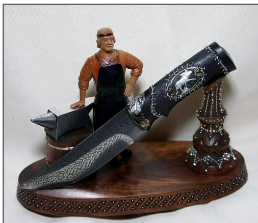
"Мастер" . Автор А. Борзов, Тула. Гравер С. Абрамов, Тула. Дамаск С. Епишкин, Тула

Завтра и на синичьи стаи напустит казюк заводного. Один такой у него уж отсажен.