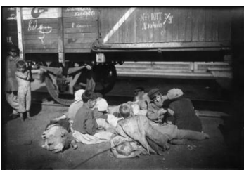
Беспризорные и голодающие дети на Николаевском вокзале, Москва, 1920

С особой силой эта проблема обострилась в 1921 г., когда на Россию обрушилась губительная засуха. Положение страны стало катастрофическим. Пришёл небывалый голод, охвативший 37 губерний. Более 7 миллионов беспризорных детей представляли собой огромную социальную беду и опасность. Создавались детские учреждения (дома ребёнка, детские коммуны, колонии, интернаты), решались вопросы эвакуации детей в благополучные районы, ширилась кампания по усыновлению беспризорных... Все это дало свои плоды. Количество беспризорных и безнадзорных детей резко сократилось.