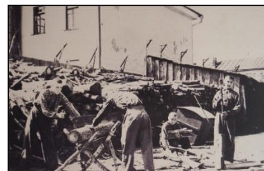
Детский спецприемник на ул. Октябрьской, в котором находилась ребятня с 3-х до 18-ти лет. Тула.

В годы Великой Отечественной войны миллионы детей потеряли родителей, что опять породило массовую детскую беспризорность и безнадзорность. Этим объясняется высокий уровень преступности среди несовершеннолетних в военные и послевоенные годы. Задача состояла в том, чтобы спасти тысячи сирот от голода, вовлечения в бродяжничество, преступность. 23 января 1942 г. Совнарком СССР принял постановление « Об устройстве детей, оставшихся без родителей ».