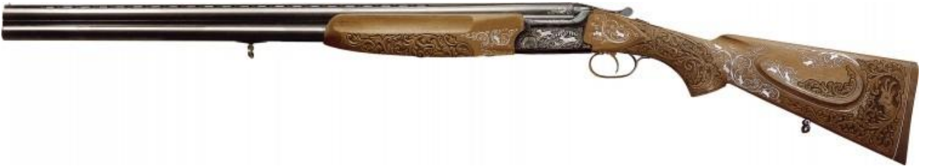
Двуствольное «призовое» охотничье ружье ТОЗ 120 12М 1Е Тульского оружейного завода, XXI век

Кранцовщица . Женск. к кранцовщик . Тул., Лен. (Отмечено Далем как тульское).