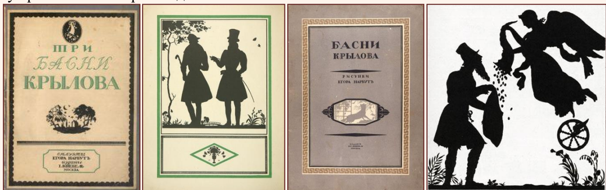
Обложки и иллюстрации к книгам «Три басни Крылова», «Басни Крылова»

Восхитительны и рисунки художника Георгия Нарбута – он создавал их не только яркими, в духе старинных иллюстраций, но и в виде графических силуэтов. Например, силуэты к басням Крылова свидетельствуют о его собственном стиле и разностороннем таланте графика. Во всех работах Нарбута чувствуется его профессионализм и стремление сделать книгу оригинальным произведением.