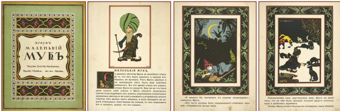
Обложка и иллюстрации к сказке В. Гауфа «Маленький Мук»