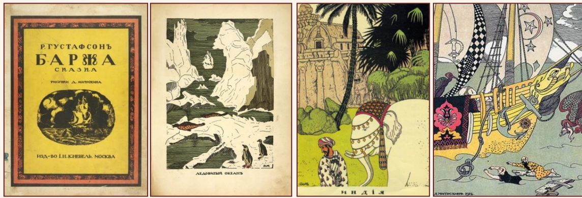
Обложка и иллюстрации к сказкам Р. Густафсона «Баржа» и В. Гауфа «Корабль-призрак»