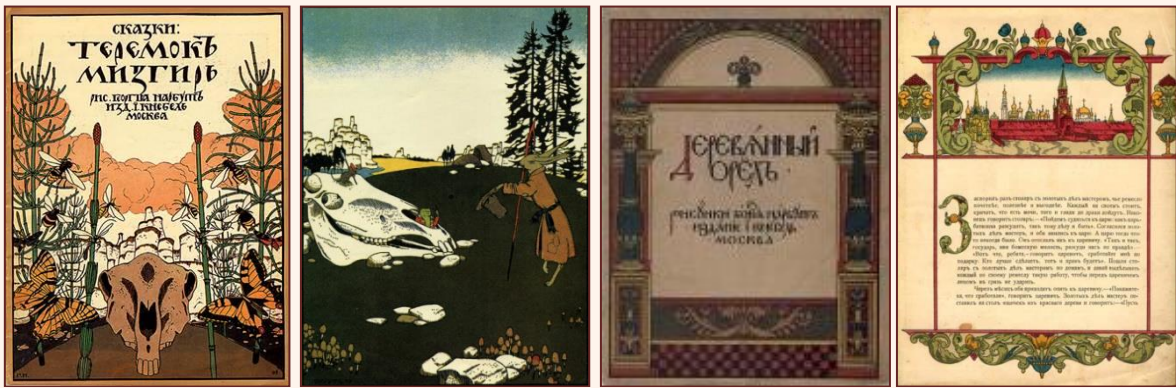
Обложки и иллюстрации к книгам «Сказки: Теремок. Мизгирь», «Деревянный орёл»