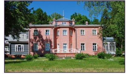
Музей-заповедник Мураново (усадьба Баратынских)

смутьянами. За несколько неосторожных слов закрывались журналы и газеты. Безвременно умер Дельвиг. Через несколько лет погиб Пушкин. Баратынский, нелегко перенесший все это, уходит в себя.