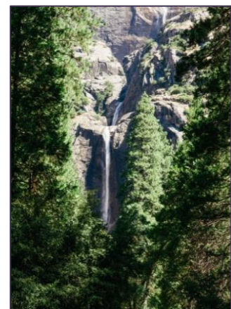
Хвойный лес и водопад. Лааявуори, Финляндия

Как всё вокруг меня пленяет чудно взор! Там необъятными водами Слилося море с небесами; Тут с каменной горы к нему дремучий бор Сошел тяжелыми стопами, Сошел – и смотрится в зеркале гладких вод! Уж поздно, день погас, но ясен неба свод; На скалы финские без мрака ночь нисходит, И только что себе в убор Алмазных звезд ненужный хор На небосклон она выводит! Так вот отечество Одиновых детей, Грозы народов отдаленных! Так это колыбель их беспокойных дней... (1820)