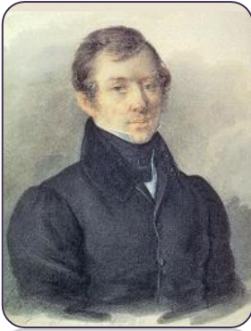
Евгений Абрамович Баратынский (Баратынский) (1800–1844)

2 марта – 220 лет со дня рождения Е. А. Баратынского (Баратынского)