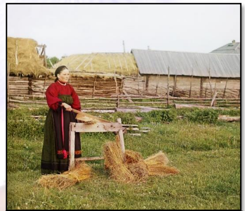
Крестьянка мнет лён. Пермская губерния. Российская Империя в 1910-1912 гг.

Лён был самой необходимой после хлеба культурой для русского крестьянина, поскольку он обеспечивал его одеждой и, кроме того, служил товаром, за который земледельцы получали деньги, необходимые для приобретения того, что в хозяйстве не производилось (соль, металлические изделия). Для получения волокна и ткани выращивают лен-долгунец, или прядильный лён. Лён-кудряш (масличный) и лён-межеумок используют для получения семян, из которых вырабатывают масло и жмыхи. Льняное масло употребляли в пищу.