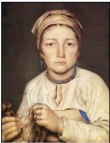
А. Г. Венецианов. Крестьянка, расчесывающая лён. 1822

Убрать лён со стлица полагалось к осеннему празднику Казанской иконы Божьей Матери (22 октября / 4 ноября).