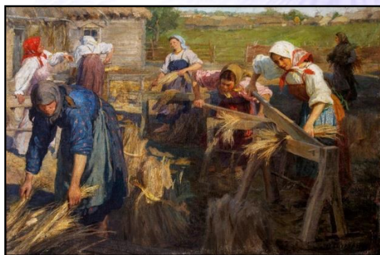
Ф. В. Сычков. Мяльщицы льна. 1905

Сев льна начинался обычно в день Олены-Льняницы (в день памяти святых Константина и Елены 21 мая / 3 июня), но сроки варьировались в зависимости от природных условий той или иной местности.