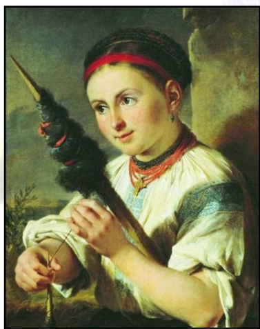
В. А. Тропинин. Пряха 1820-е

После очёса скатывали кудели и принимались прясть. Всю эту сложную работу полагалось закончить к Рождественскому посту (15 (28) ноября). Готовое волокно девушки или пряли, чтобы потом наткать полотна, или же продавали, чтобы на вырученные деньги купить необходимые для приданого вещи.