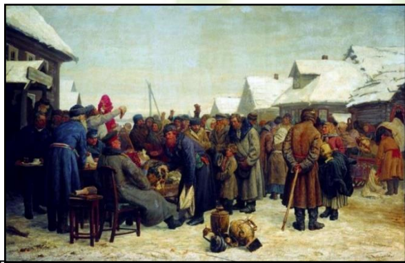
В. М. Максимов. Аукцион за недоимки. 1881-82 гг.

Налоги выплачивало общество, а не отдельный крестьянин. Общество отвечало за каждого её члена, то есть несло круговую поруку. Крестьянин не мог свободно выйти из общества или продать земельный надел. Даже уйдя на заработки по разрешению схода, он должен был платить тягло.