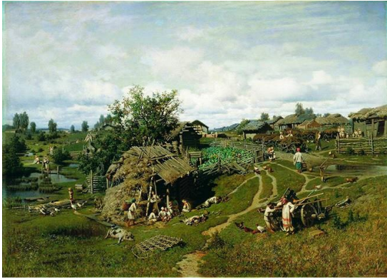
П. А. Суходольского Полдень в деревне. 1864 год

Раскроем часть четвёртую «Словаря тульских говоров» Д. А. Романова и Н. А. Красовской на 89 странице, изданного в Туле в 2022 году: Семитьба –ы, ж. Поселение, крестьянская община . Бел. Топоним Семитебная слобода. (Барабашов).