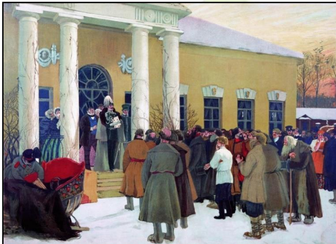
Б. М. Кустодиев. Чтение манифеста. 1907 год

19 февраля (3 марта) 1861 года в России был издан царский Манифест об отмене крепостного права. Крестьяне стали лично свободными, но земля осталась собственностью помещика. Земельный надел крестьянин должен был выкупить, при этом он выплачивал 20% из собственных средств, а 80% платило государство.