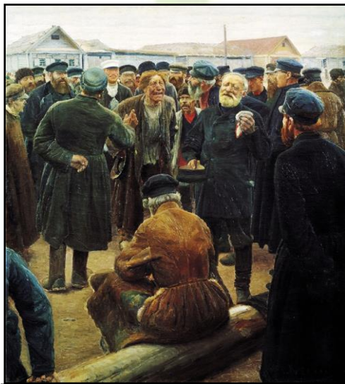
С. А. Коровин. На миру. 1893 год