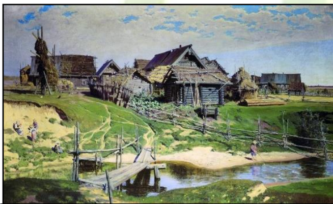
В. Д. Поленов. Русская деревня. 1889 год

В Тульской губернии земля стоила по тем временам немало: «добрая», т. е. плодородная, по 10 рублей за десятину (десятина конца XVIII – начала XIX вв. была равна площади в 1,45 га), «средняя» – по 5 рублей, «плохая» – по 2 рубля за десятину.