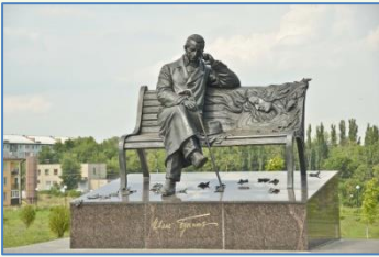
Памятник И. А. Бунину. Центральный городской парк им. И. А. Бунина в Ефремове

Первое посещение Буниным Ефремова было связано с желанием познакомиться с великим русским писателем Л. Н. Толстым. В 1887 году семнадцатилетний Иван Бунин отправляется в Ясную Поляну. «В ранней молодости я был совершенно влюблен в него, в тот мной самим созданный образ, который томил меня мечтой увидеть его наяву. Мечта эта была неотступная, но как я мог тогда осуществить ее? Поехать в Ясную Поляну? Но с какой стати, с какими глазами? «Что вам угодно, молодой человек?» – спросят меня в Ясной Поляне. И что я отвечу тогда?»