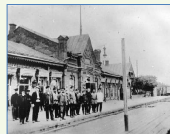
Старый вокзал в Ефремове. 1895–1915.

Ефремов – город удивительный и представляет собой жизнь в глубинке такой, какая она есть. Старинные дома, похожие друг на друга улицы... Когда-то по здешним местам прогуливался Иван Бунин, приехавший погостить к своему брату. Вдохновившись местным колоритом, Иван Алексеевич увековечил его в своем произведении «Чаша жизни», сделав прототипом города Стрелецка. В рассказе описал он и улицу, на которой жил, и железнодорожный вокзал, с которого уезжал и приезжал в Ефремов. Отзвуки пребывания И. А. Бунина на ефремовской земле мы находим в сборнике «Антоновские яблоки», которыми так богат Ефремов и Ефремовский уезд, в бунинской поэзии. Впечатления от посещения этих мест прослеживаются и в других его прозаических и стихотворных произведениях, дневниковых записях, воспоминаниях.