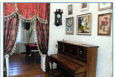
Залы Дома-музея И. А. Бунина. Общий вид и обстановка начала XX века, того времени, когда в доме бывал сам писатель. Так же здесь можно увидеть некоторые рукописи, письма, личные вещи писателя и его семьи