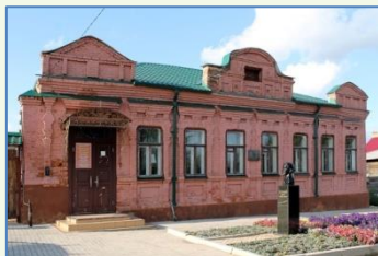
Дом Буниных по ул. Тургенева (сейчас Дом-музей)