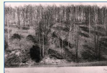
Ефремов. Березовая роща. Начало XX в. Фотография