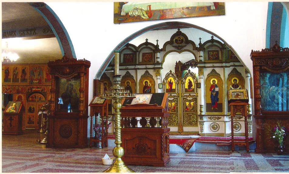
Храм Покрова Пресвятой Богородицы

мещалось городское училище. В настоящее время здесь находится монастырское подворье с храмом Иверской иконы Божией Матери.