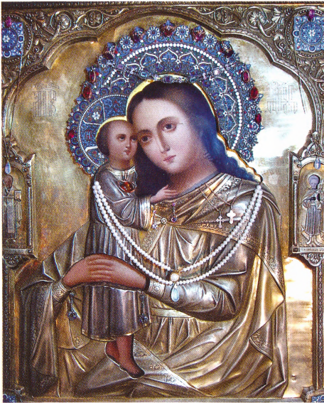
Чудотворная икона Божией Матери «Взыскание погибших»