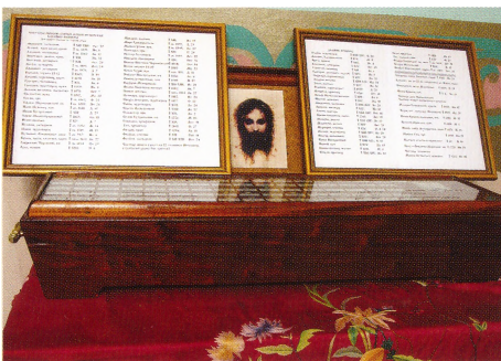
Ковчег с частицами мощей преподобных отцов Киево-Печерских