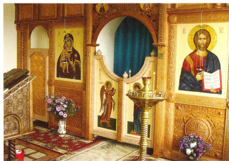
Больничный храм в честь иконы Божией Матери Феодоровской