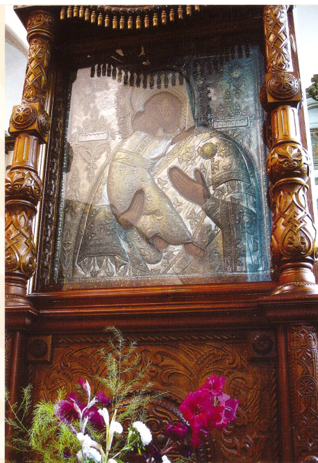
Икона Божией Матери «Владимирская»