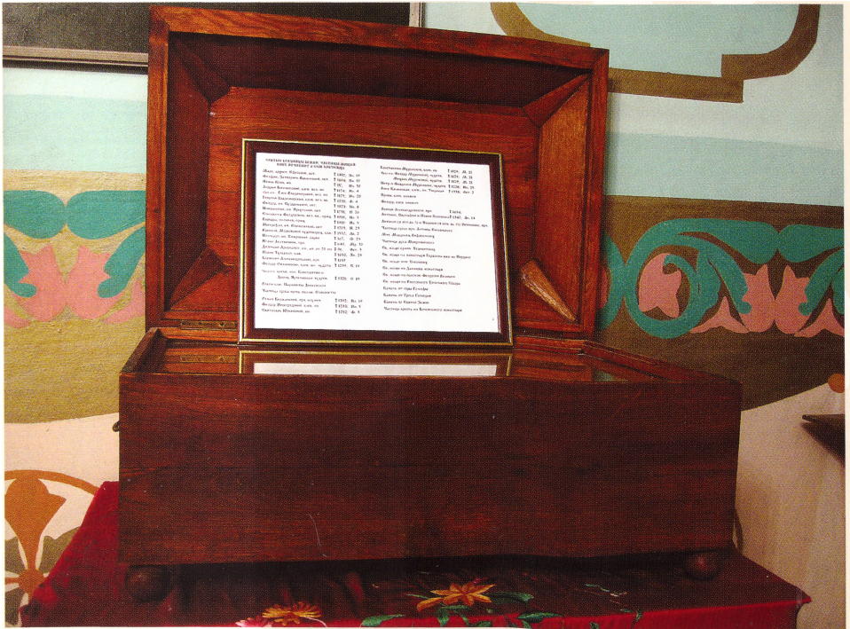
Ковчег с частицами мощей

Именно на него легли основные труды по созиданию новой обители. Особая забота отца Лавра направлена на укрепление духовной жизни монашеской обители, на устройство правильной внутренней