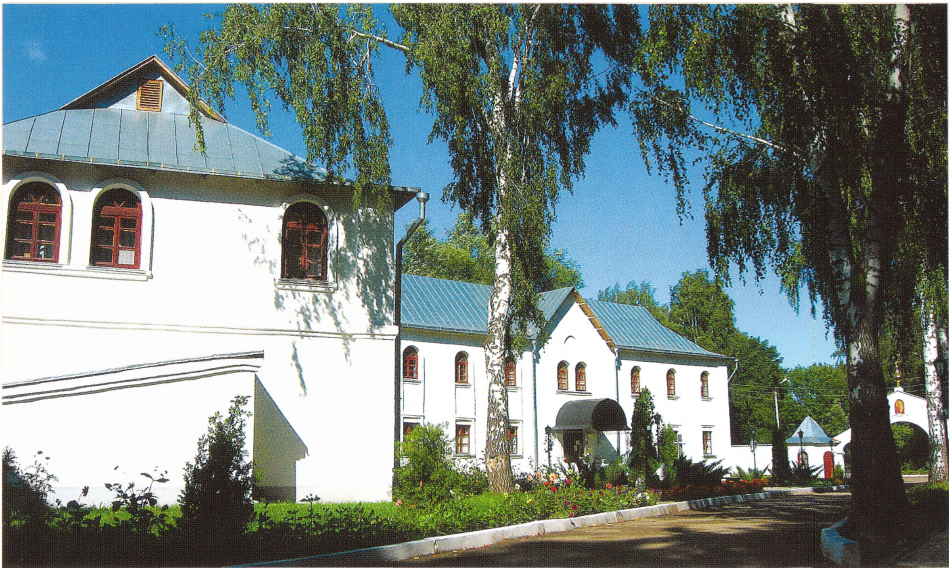
Наместнический и братский корпуса