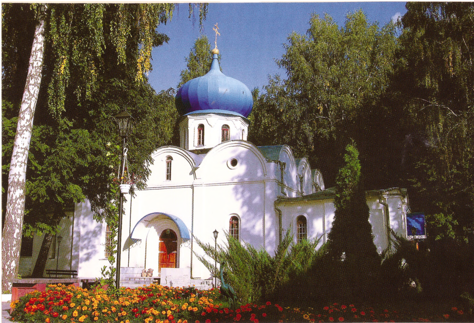
Храм Успения Пресвятой Богородицы

Н овомосковск – город молодой, ему нет еще и ста лет, но по численности живущих в нем он не уступит многим древним городам Руси Великой. Его начали строить в то время, когда государственная власть отрицала позитивное значение православного вероучения, делая, таким образом, попытку обесцветить многовековой культурно-исторический опыт русского народа. Когда по всей стране закрывали храмы и заново переписывали историю России, в северо-восточной части Среднерусской возвышенности.... В 60 километрах от Тулы, по приказу