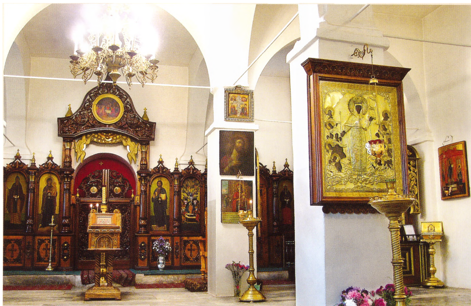
Храм Успения Пресвятой Богородицы

В середине 90-х городские власти передали обители помещения в поселке Клин, в которых ранее раз-