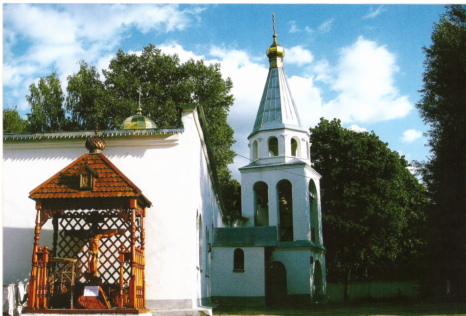
Храм Покрова Пресвятой Богородицы

с 60-х годов, было недостаточное количество приходов, которое не соответствовало числу членов Церкви. Так было по всей стране, но особенно остро это касалось новых городов, возникших из так называемых комсомольских строек, в которых, несмотря на значительное количество проживающих, не было ни одного православного храма. Юбилейный 1988 год принес с собой значительные перемены в церковной жизни Тульской епархии. Как и по всей стране, стали открывать закрытые храмы и строить новые. В начале 90-х перемены коснулись и Новомосковска. Здесь была зарегистрирована православная община, которой администрация города предоставила возможность выку-