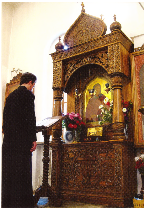
Ковчежец с частицей мощей блаженной Матроны Московской

жизни иноков. Много сил отнимают и хозяйственные вопросы, связанные со строительством и ремонтом храмов, зданий и коммуникаций монастыря. За довольно короткое время на месте, где прежде было городское кафе, появился храм Покрова Божией Матери с приделом в честь иконы Божией Матери «Взыскание погибших».