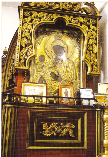
Чудотворная икона Божией Матери «Троеручица»