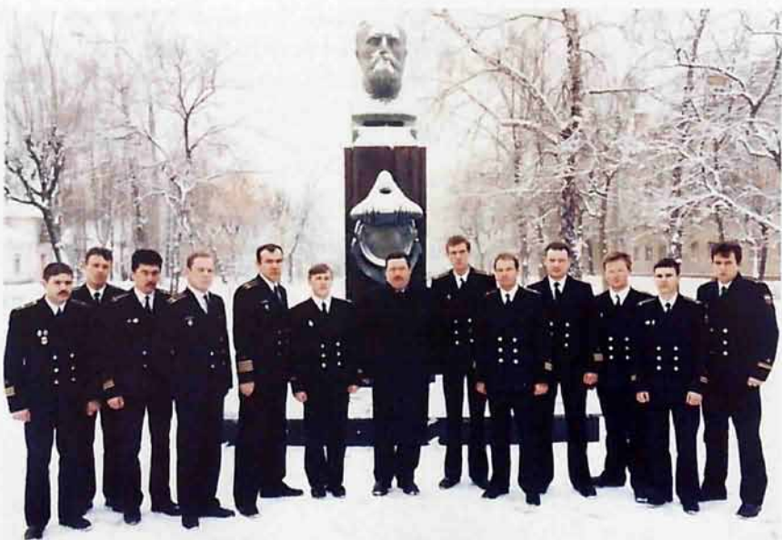
Офицеры-подводники у памятника В.Ф.Рудневу в Новомосковске (12 декабря 1999г.)

приняло массовый характер. А тогда, в 1996-м, это была совершенно новая идея. Экипажу нужна была, прежде всего, моральная поддержка, и мы это сделали вовремя.