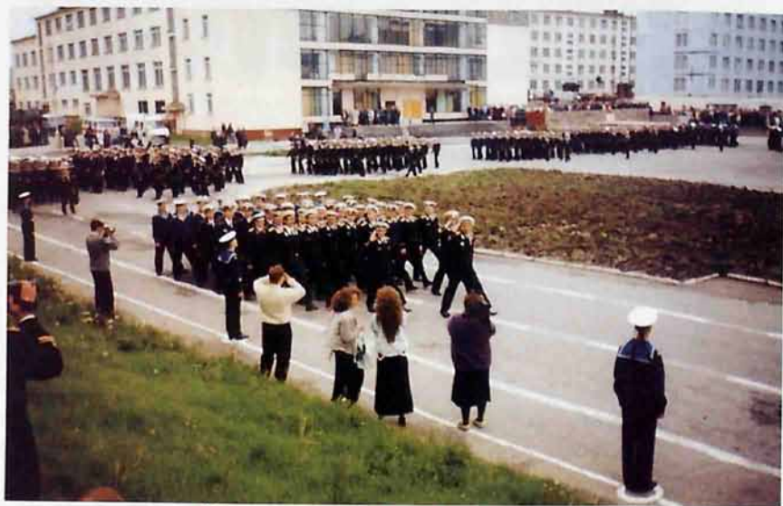
Торжественный парад в г.Гаджиево, посвященный Дню Военно-морского флота (июль 2000г.)

— Условия суровые. Не каждый их выдержит, — вспомина-