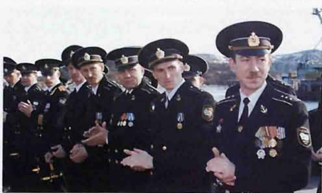
Торжественное построение экипажа на пирсе (30 апреля 2006г.)

му был вручен редкий подарок - настоящий офицерский кортик с дарственной надписью. Затем моряки-североморцы посетили исток Дона, ознакомились с экспозицией двух музеев - истории Новомосковска и археологического, возложили цветы к памятнику В.Ф.Рудневу, побывали в физкультурно-оздоровительном комплексе «Олимп», совершили экскурсию по улицам города.