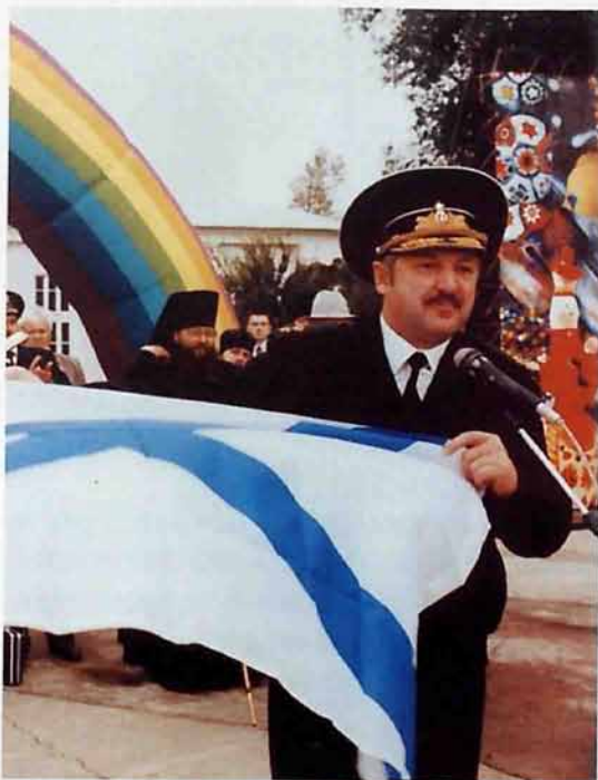
Вице-адмирал С.В.Симошенко на празднике в День города Новомосковска

Торпеды и ракеты несут в себе мощь, по тротиловому эквиваленту превосходящую суммарную силу взрывчатки, использованной в двух мировых войнах всеми воевавшими сторонами. Огромные возможности предполагают огромную ответственность. Один человек не может выпустить ракету: для её запуска необходимы повороты одновременно трёх ключей. Ракета в полёте поднимается на высоту, превышающую орбиту космических кораблей примерно на 200 километров. Её полезная нагрузка составляет почти три тонны, дальность стрельбы до 8300 км.