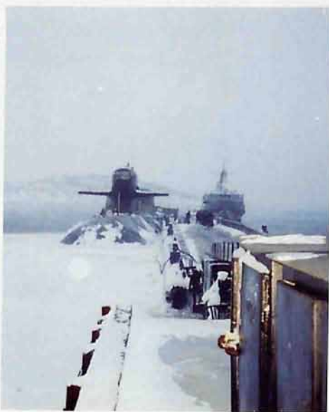
Заполярье - край суровый

С ответным визитом новомосковская делегация прибыла 23 февраля 1997 в г. Скалистый, где базировалась лодка. Город за сорок лет существования сменил четыре названия: Ягельная Губа, Мурманск-130, Гаджиево, ЗАТО (закрытое административно-территориальное образование) Скалистый, а в последнее время опять вернул имя Гаджи-