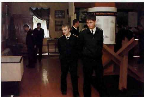
Офицеры-подводники в историческом музее г.Новомосковска (лето 2005г.)

рил «Новомосковск» в правый борт, но при этом получил такие повреждения, что был списан на слом. Поэтому моряки могли бы с полным основанием нарисовать на борту звезду: одну американскую лодку уничтожили. Это случилось в 1993 году.