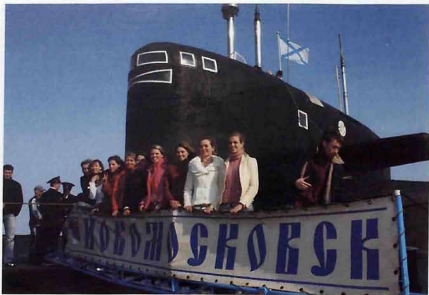
Ансамбль эстрадного танца «Юность» на борту «Новомосковска» (30 апреля 2006г.)

Зрители были в восторге. В завершение праздника командующий дивизией атомных подводных лодок Владимир Королев