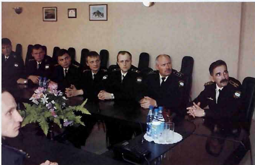
Официальный прием офицеров-подводников в Новомосковской муниципальной администрации (лето 2005 г.)

О крейсере К-407 разговор особый. Когда только устанавливались шефские связи, новомосковцы и знать не знали, что породнятся с уникальным кораблем Северного флота.