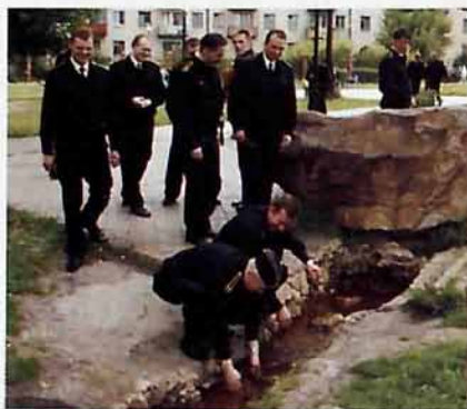
Офицеры крейсера у истока Дона (лето 2005г.)

ковска. В нем - строительные материалы для ремонта спортивного зала... Спортивные костюмы, штанги и гири, боксерские перчатки и «груши», футбольные и волейбольные мячи, стиральная машина, столы, стулья. Очень удивило и порадовало моряков содержимое «посылки»: именно то, что нужно.