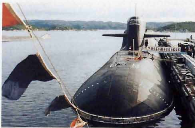
Гордость подводного флота России - атомный подводный крейсер стратегического назначения «Новомосковск»