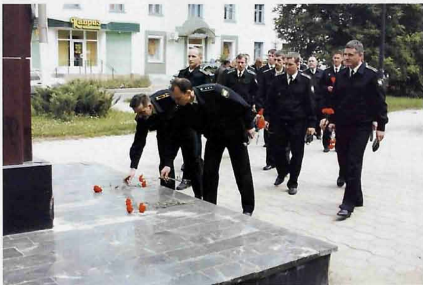
Возложение цветов к памятнику Рудневу

Офицеры не скрывают: новомосковские ребята служат отлично, воспитаны нормально.