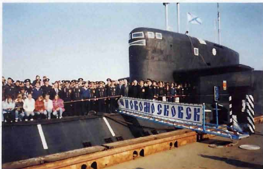
Торжественное построение экипажа на пирсе (30 апреля 2006г.)

мощь. «Такая погода у нас бывает только в июле, — заметили моряки. — Погожие дни вообще - редкость. В основном дожди, холодный ветер с моря и тяжелый туман».