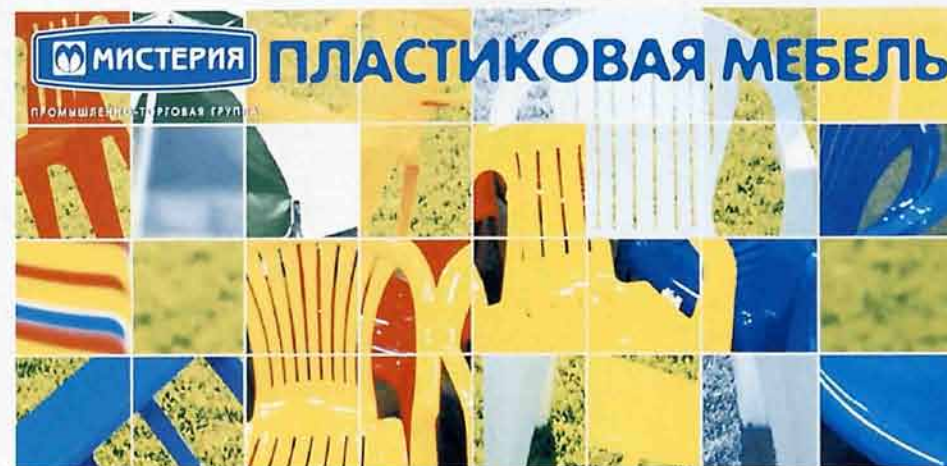
Joint-stock company «Mystery Layer»

The volume of investments will make 750,0 million roubles.