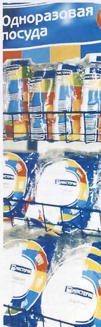
ЗАО «Мистерия Пласт»

Объем инвестиционных вложений составит 750,0 млн. рублей.