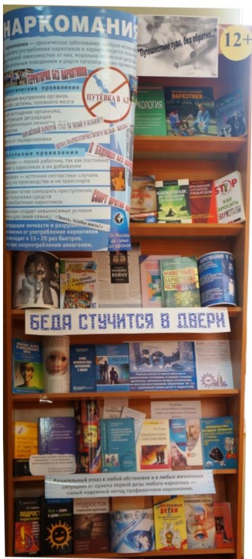
Книжная выставка «Беда стучится в дверь», оформленная в Центральной городской библиотеке

Органы и учреждения Новомосковска, работающие с детьми, принимают активное участие в проведении мероприятий в рамках Международного дня борьбы с наркоманией, наркобизнесом и алкоголизмом.