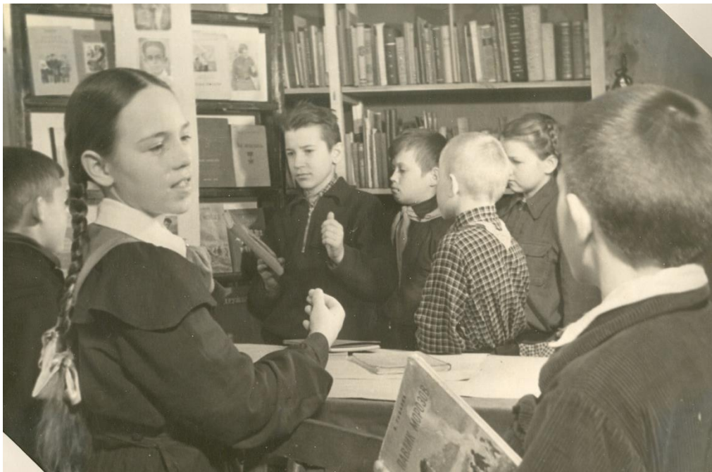
Сталиногорская детская библиотека. 30-40-е гг. XX в. Располагалась в здании школы № 18

Было куда пойти отдохнуть – в парк, в летний кинотеатр, в многочисленные клубы, библиотеки. Последних, например, было тогда 25 с общим книжным фондом в 215 тыс. томов. В двенадцати клубах города и 208 красных уголках занимались десятки кружков художественной самодеятельности.