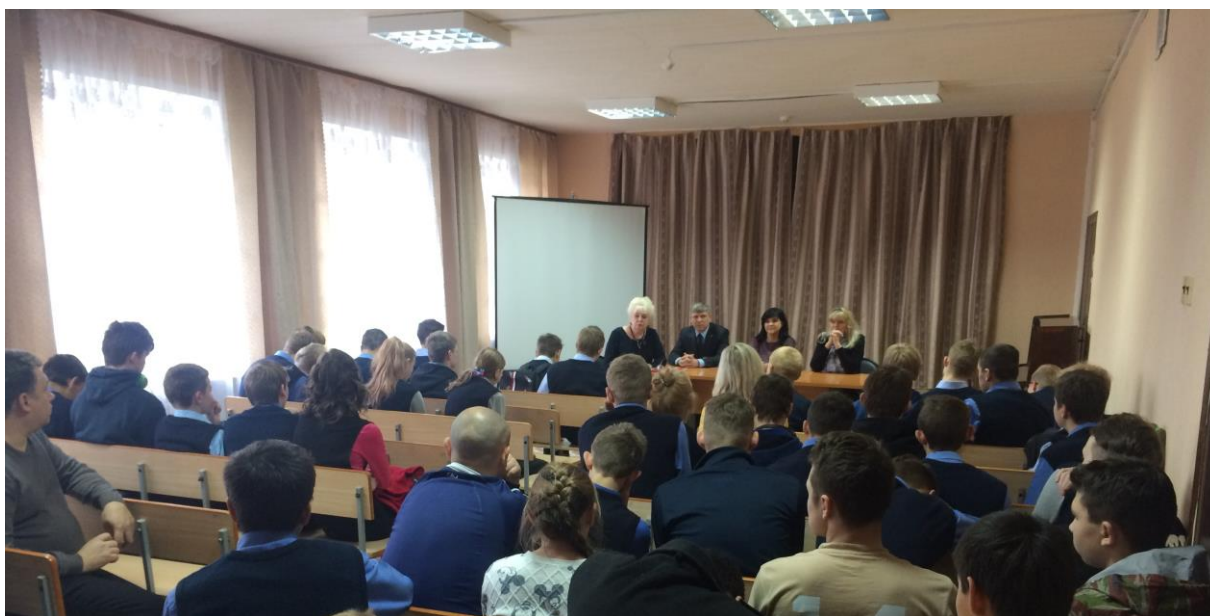
Встреча представителей комиссии по делам несовершеннолетних и защите их прав с воспитанниками Новомосковского областного центра образования. 2017г.

Ежегодно, в ноябре месяце в рамках проведения Всероссийского дня правовой помощи детям, в образовательных организациях города организуются встречи детей и родителей с представителями судебной системы и прокуратуры, комиссии по делам несовершеннолетних и правоохранительных органов, отдела социальной защиты населения и отдела опеки и попечительства.