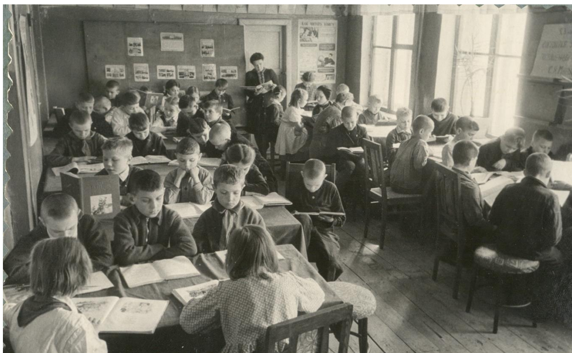
Школа № 18. 30-40-е гг. XX в.

Детские сады и ясли сначала размещались в зданиях барачного типа. С 1937 г. стали строить капитальные двухэтажные дома со всеми удобствами. В 1937–1939 гг. таких кирпичных зданий было возведено девять – пять яслей и четыре детсада. А всего перед войной в городе функционировали 11 яслей на 900 детей и 20 детских садов, которые посещали 1450 детей.