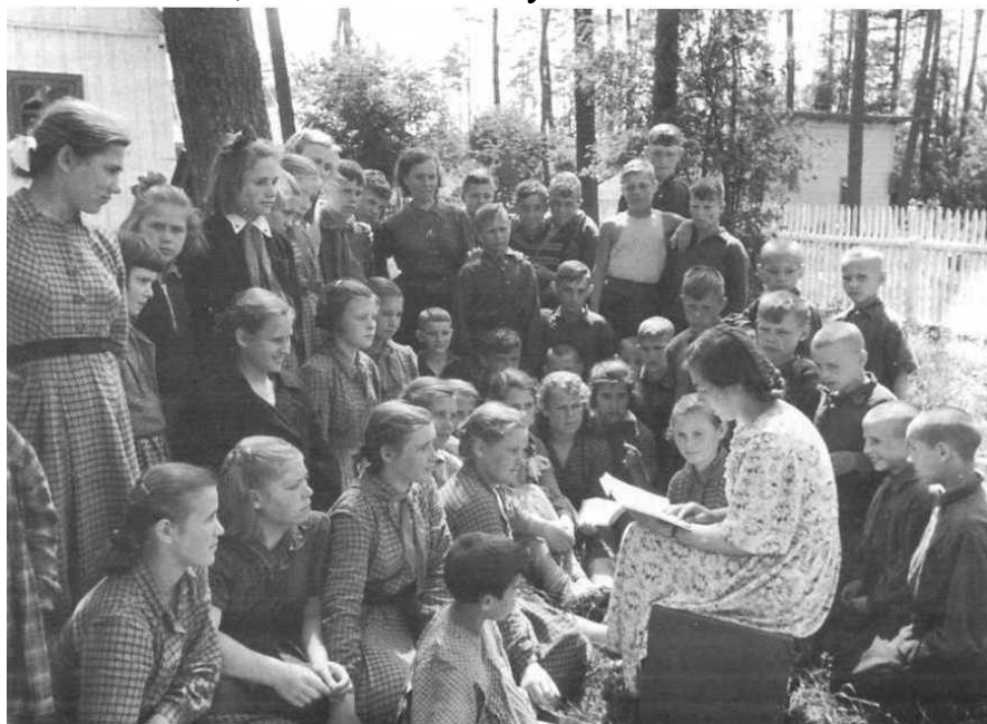
Воспитанники Сталиногорского детского дома. Конец 1940-х гг.

Изнурительный труд на промышленных предприятиях без отпусков не оставлял родителям сил и времени для надлежащего присмотра за детьми. Не хватало средств, чтобы одеть и обуть их. В 1945 г. из-за отсутствия обуви и теплой одежды школу не посещали более 2,5 тыс. детей в Тульской области.