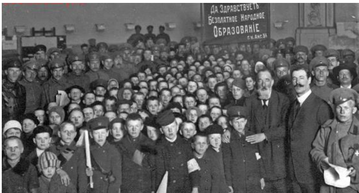
Группа учеников городского училища с лозунгом «Да здравствует бесплатное народное образование». Петроград, 1917 г.

После октябрьской революции 1917 г. заботу о детях-сиротах государство взяло на себя. С первых дней установления советской власти главными факторами в борьбе с правонарушениями несовершеннолетних были признаны воспитательная и предупредительная работа.