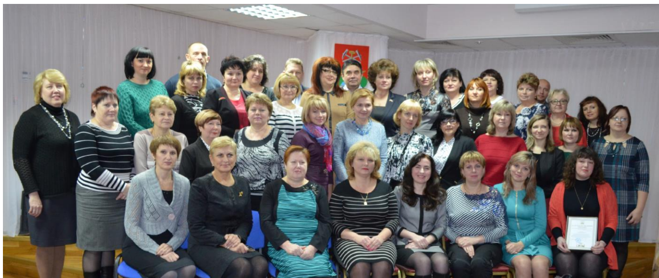
Участники открытого заседания муниципальной комиссии по делам несовершеннолетних и защите их прав. 2014г.

12 декабря 2014 г. в Центральной городской библиотеке состоялось презентация муниципальной модели общественного патронажа (наставничества) над семьями, находящимися в социально опасном положении.