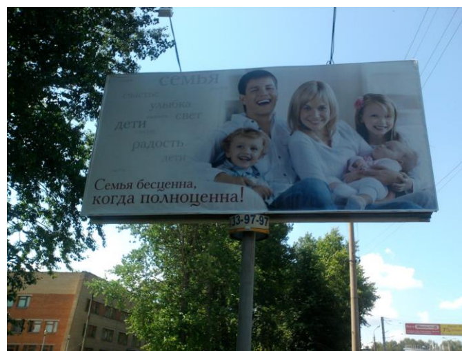
Социальная реклама на улицах города

Для оказания более эффективной помощи ребенку и семье в городе отработана система гибкого взаимодействия с административными органами и учреждениями, работающими с несовершеннолетними. В целях организации комплексной индивидуальной профилактической работы с несовершеннолетними и семьями, находящимися в социально опасном положении, созданы территориальные социальные комиссии, которые функционируют до настоящего времени.