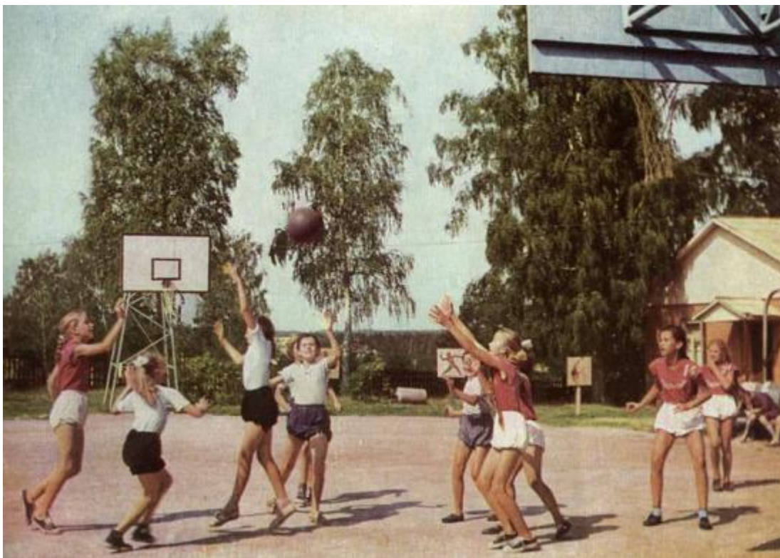
Дети в пионерском лагере.

В колхозе «3-я Пятилетка» организован комсомольский лагерь для детей старшего возраста. Подростки работали на полевых работах по шесть часов – 3 часа утром и 3 часа вечером, остальное время были заняты физкультурой, ходили в походы по изучению города и окрестности.