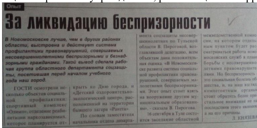
Статья в газете «Новомосковская правда» от 28.08.2004 г.

Система профилактики безнадзорности, беспризорности и правонарушений несовершеннолетних в 2000-е гг. стремительно развивалась. В 2004 г. департаментом социальной защиты населения Тульской области дана положительная оценка органам и учреждениям, работающим на территории города.