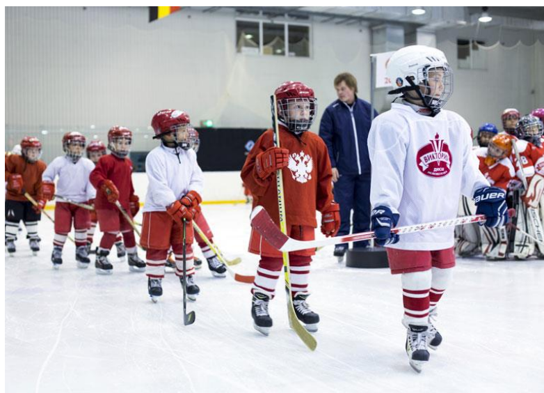
Занятия в Ледовом Дворце

В городе особое место занимает развитие физической культуры и массового спорта среди детей, подростков и молодежи. Высокими темпами вводятся в эксплуатацию новые спортивные объекты – Ледовый Дворец, спортивный зал «Виктория», вело-лыже-роллерная трасса, ФОК «Шахтер», ФОК «Мечта», теннисный центр «Жемчужина», второй ледовый тренировочный каток.