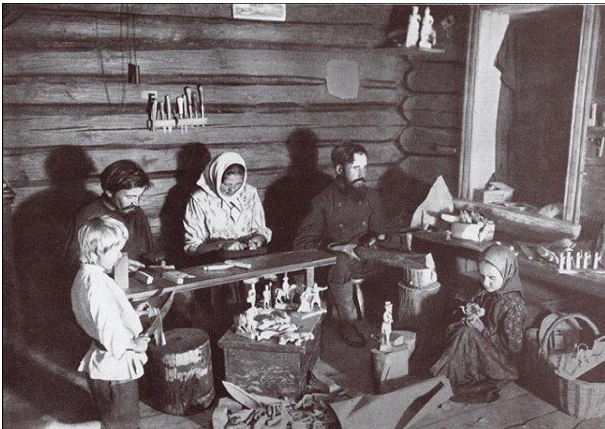
Семья ремесленников. 1920 г.

освобождаемый от уплаты единого налога на три года. Кроме того, крестьяне пользовались правом бесплатного обучения воспитанника в школе и получали на него единовременное пособие.