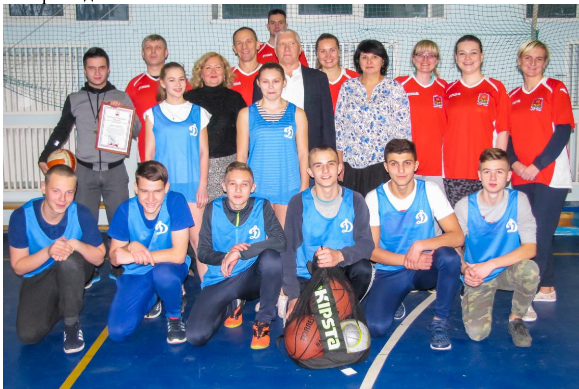
Товарищеская встреча по волейболу.

В целях укрепления межведомственного взаимодействия с целью повышения эффективности профилактики правонарушений и преступлений на территории муниципального образования с 2006 действует «Комплексный план профилактики безнадзорности, правонарушений несовершеннолетних, обеспечения защиты их прав и законных интересов на территории муниципального образования город Новомосковск, который принимается и утверждается постановлениями МКДНиЗП сроком на три года.