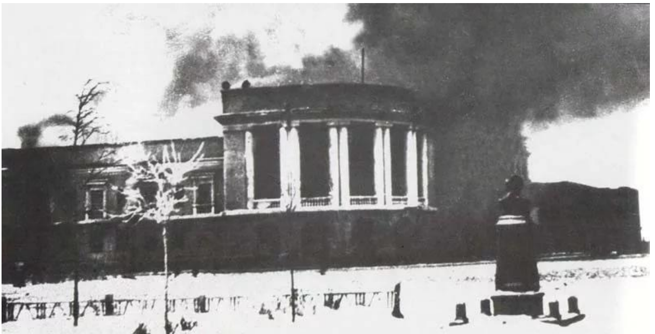
г. Сталиногорск. 1941 г.