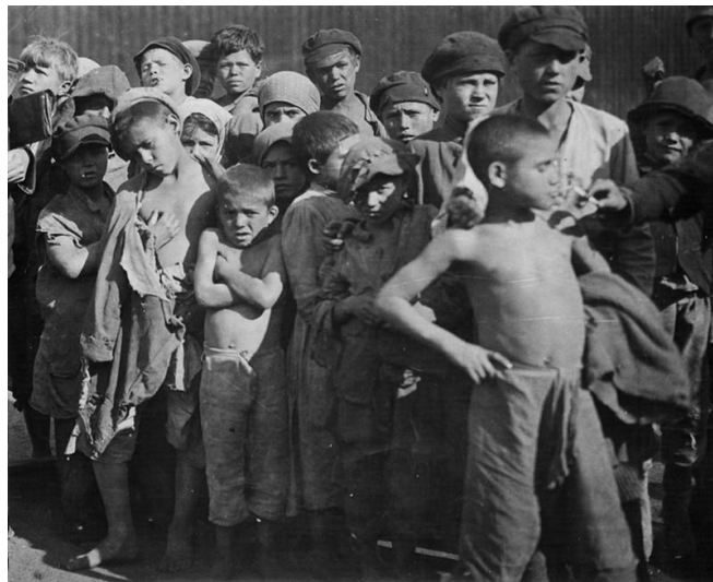
Группа детей беспризорников. 1922 г.

В обеспечение исполнения законов об охране детства, в борьбу с беспризорностью и правонарушениями в подростковой среде сразу после своего создания включились органы прокуратуры. Так, циркуляром ВЦИК за подписью М. И. Калинина от 20 июня 1924 г. на прокуратуру возлагалось наблюдение за неуклонным осуществлением местными органами установленного порядка реэвакуации и привлечения к ответственности лиц, виновных в его нарушении. Большую работу проводила прокуратура по обеспечению законности в деятельности детских учреждений для беспризорных, борясь против хищений и бесхозяйственности, жестокого обращения с детьми.