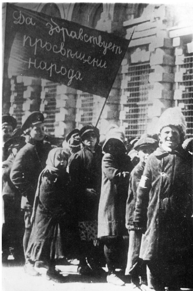
Просвещение народа. 1917 г.

4 марта 1920 г. СНК РСФСР было принято Постановление «О несовершеннолетних, обвиняемых в общественно опасных действиях». В нем вновь подтверждалась основная идея Декрета СНК от 14 января 1918 г. о том, что все дела об общественно опасных деяниях несовершеннолетних подлежат ведению комиссии по делам несовершеннолетних.