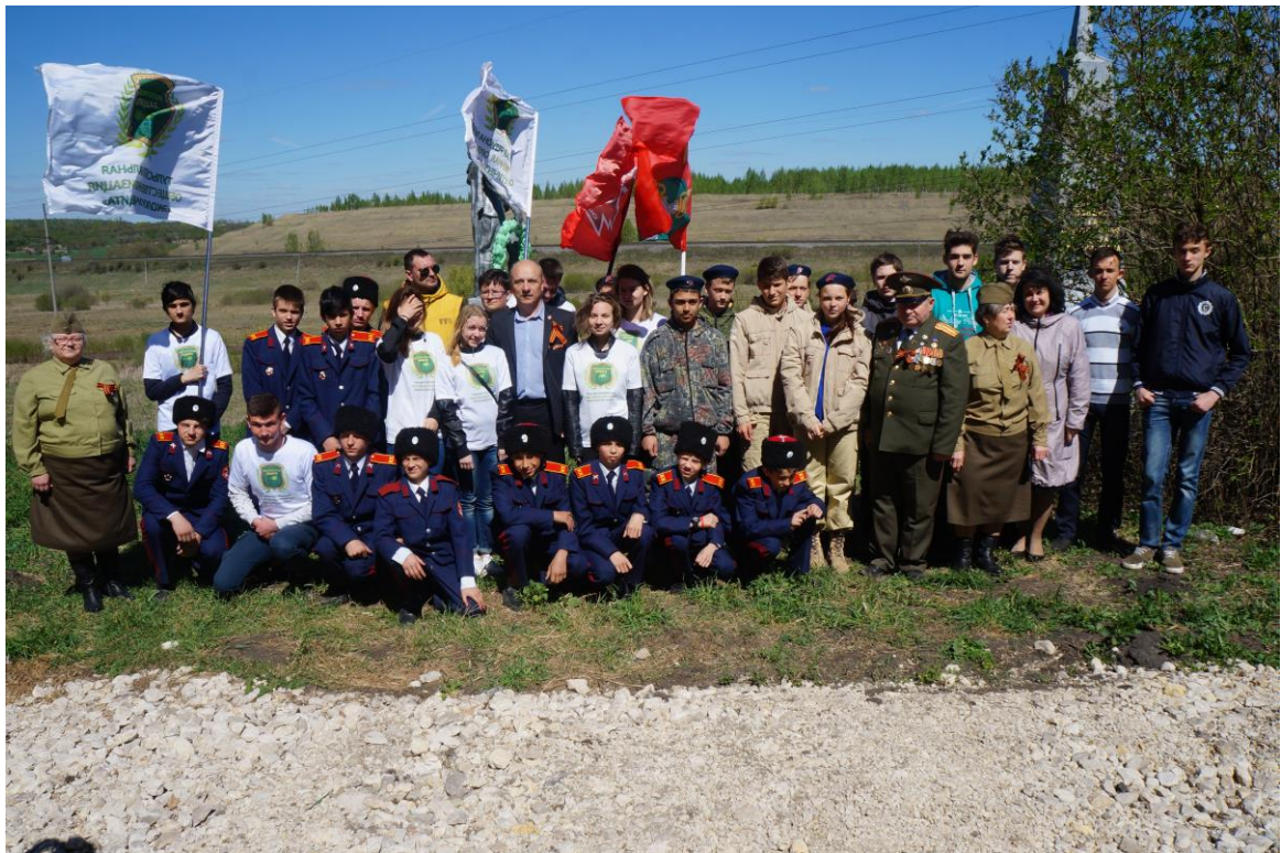
Муниципальное отделение Всероссийского детского юношеского военно-патриотического общественного движения «Юнармия»

В целях повышения статуса и престижности семьи и формирования здорового образа жизни, воспитания будущих матерей работниками акушерско-педиатрических терапевтических комплексов во всех лечебно-профилактических учреждениях проводилась широкая разъяснительная работа среди населения, включая подростков.