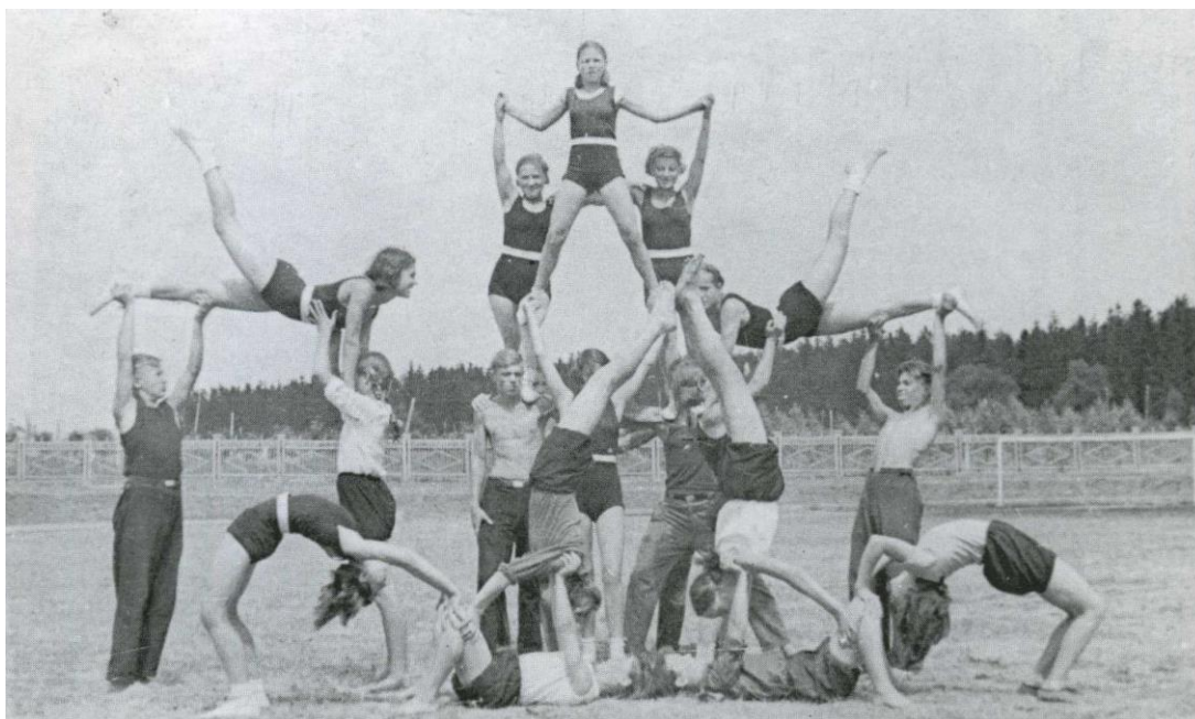
Гимнастическая пирамида в исполнении юных спортсменов. Конец 1940-х гг.

Обязательное решение вступило в законную силу через 15 дней со дня опубликования в печати и действовало на территории Сталиногорска в течение 2-х лет.