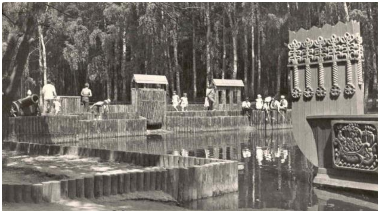
Детский парк. 80-е гг. XX в.

Общими усилиями в 50-е гг. создан Детский парк. Инициатива принадлежала работникам комбината «Москвоуголь». Появилась плотина с водостоком и аркой. На берегу водоёма оборудовали павильон для купания, спортивные площадки, построили Зеленый театр на тысячу мест, аттракционы. Рощу обнесли хорошей изгородью. А вокруг была сооружена детская железная дорога (строительство начато в 1953 г.) со своим депо, с двумя станциями – «Березки» и «Дубки». Теперь Сталиногорская детская железная дорога протяженностью около двух километров имеет 2 паровоза, три пассажирских вагона. Детский парк стал любимым местом отдыха детворы и взрослых, достопримечательностью Сталиногорска.