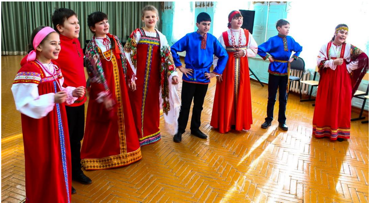
Фольклорный ансамбль Детской школы искусств.

Проведена реконструкция многофункциональной спортивной площадки с искусственной травой в одной из общеобразовательных школ города. Введен в эксплуатацию физкультурно-оздоровительный центр. В рамках инвестиционного проекта «Подарим детям стадион» на базе городской школы № 9 построено футбольное поле с искусственной травой для спортивных классов.