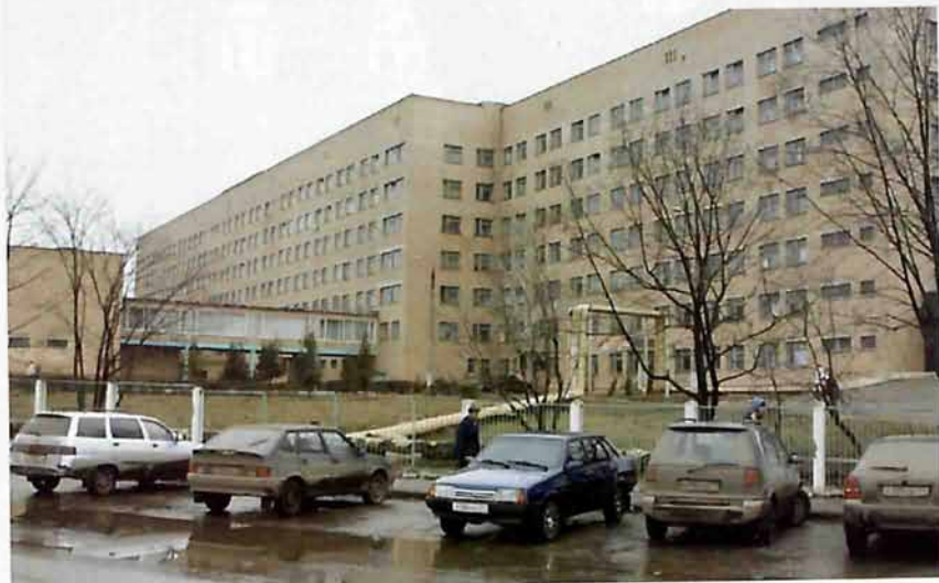
МУЗ «Новомосковская городская клиническая больница»

На фасаде здания городской больницы №1 (ныне МУЗ «Новомосковская городская клиническая больница») решением горисполкома № 1519 от 16 мая 1965 года, открыта мемориальная доска в память о Федоре Ионовиче Пашанине.