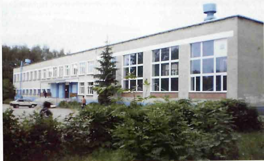
МОУ «СОШ № 20»