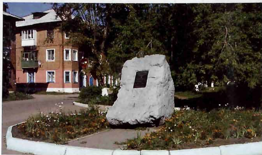
Символ вечной памяти погибшим в ВОВ

Протоколом № 14 исполкома Сокольнического поселкового Совета депутатов трудящихся Гремячевского района Московской области от 3 января 1956г. утверждены названия улиц в 24 квартале поселка Сокольники: