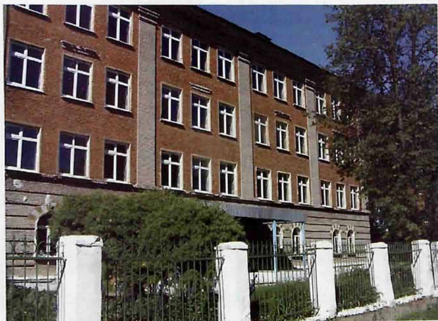
МОУ «Сокольщическая СОШ № 1»

В соответствии с Законом Тульской области от 24 октября 2008г. №1103-ЗТО город Сокольники Новомосковского района Тульской области присоединен к городу Новомосковску Новомосковского района Тульской области.