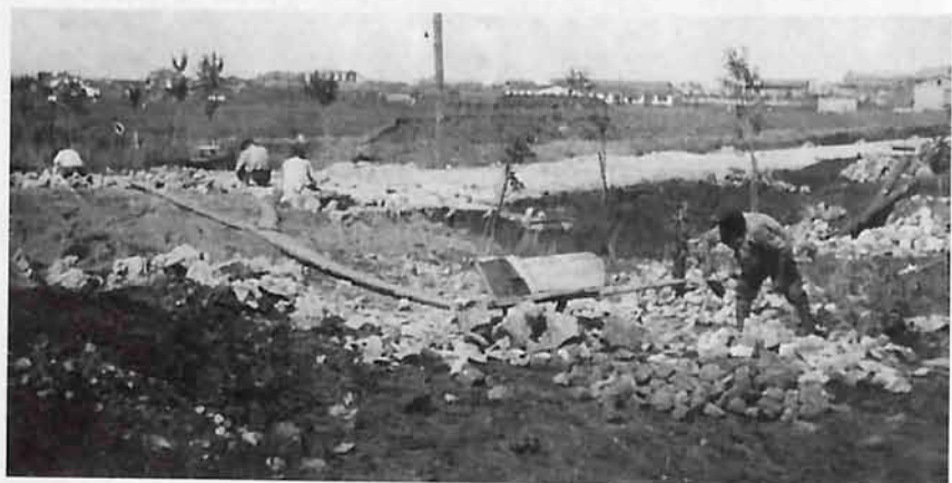
Со Косомольского шоссе, начало 1930-х годов

Жилищное строительство велось в основном от Соцгорода, который постепенно расширяясь присоединял и поглощал расположенные рядом поселки. Один за другим вырастали новые кварталы - дома возводились по периметру вокруг замкнутого большого двора. Такая застройка, в условиях расположения города, была разумной, поскольку внутриквартальные территории защищались зданиями от сильных ветров.