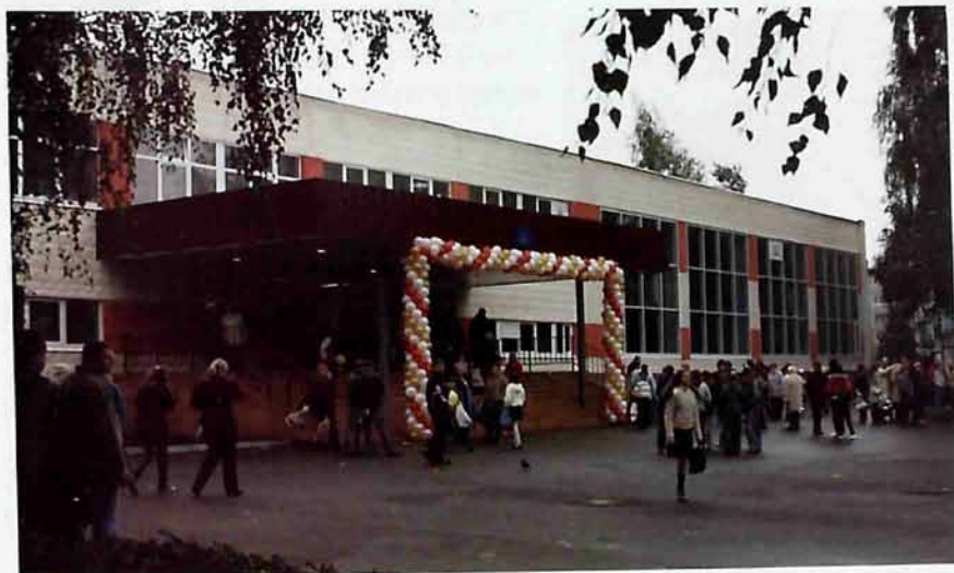
МОУ «СОШ № 17»

Решением Новомосковского горисполкома № 1282 от 23 декабря 1971 года, в связи со строительством домов в районе Залесного микрорайона, улице, идущей параллельно шоссе Северо-Задонск, присвоено наименование Проспект Победы.