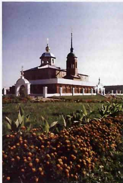
Храм «Нечаянная радость»