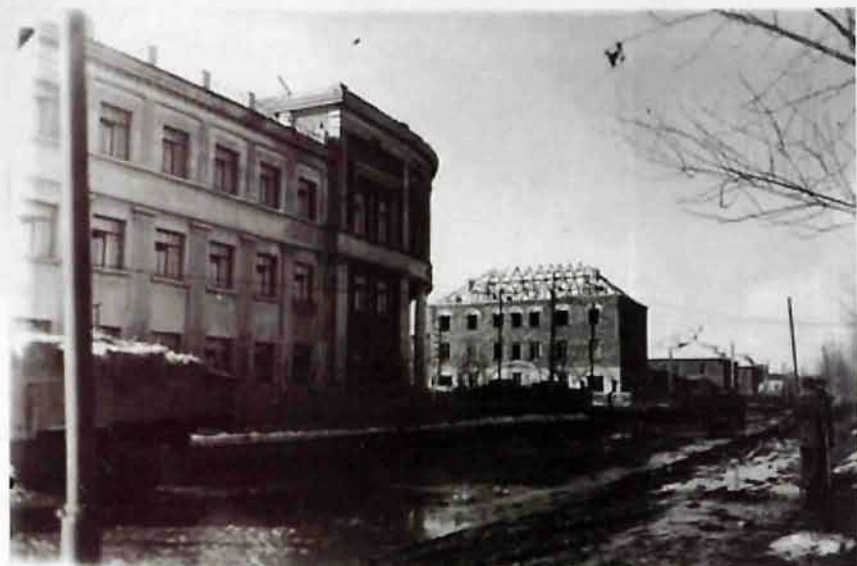
Здание Ново-Моковскиххимстрой в 50-х годах

«В связи с ростом строительства города застроены новые кварталы жилых домов, в результате оформились городские улицы, что является необходимым назвать улицы города.»