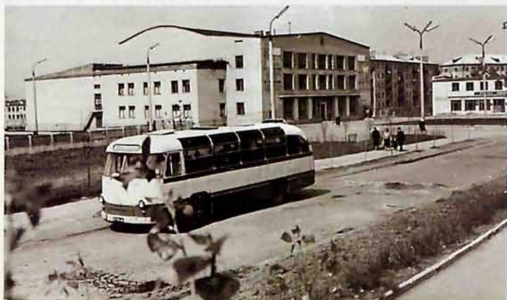
«Дворец спорта» на ул. Березовая

На улице расположен Новомосковский музыкальный колледж (бывшее музыкальное училище, введено в эксплуатацию в 1959 году), детская музыкальная школа № 1 (здание школы введено в эксплуатацию в 1970 г., решение Новомосковского горисполкома № 1366 от 30.12.70г.), фотосалон «Сюжет» (фотокомбинат принят в эксплуатацию в 1970 г., решение Новомосковского горисполкома № 375 от 31.03.70г.)