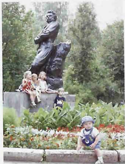
Памятник А.С. Пушкину в сквере