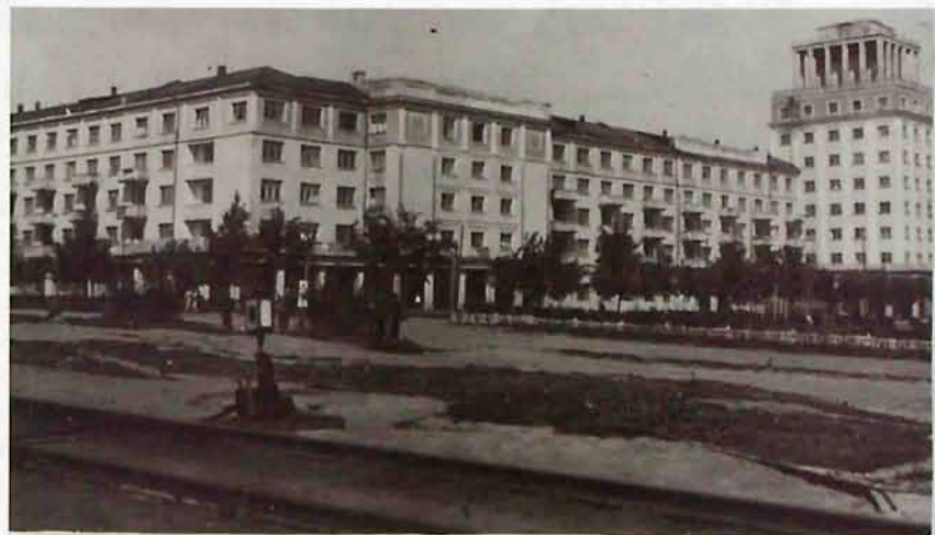
ул. Московская 1960-х годов