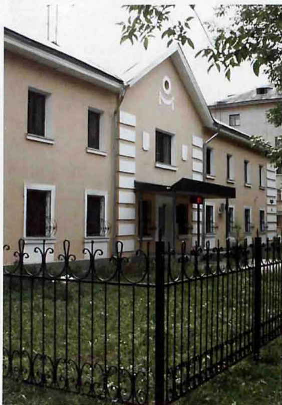
Отделение по Новомосковскому району управления Федерального казначейства по Тульской области

Улица «Трудовых резервов» (так улица называлась изначально), построенная в послевоенные годы, была границей города на западе,