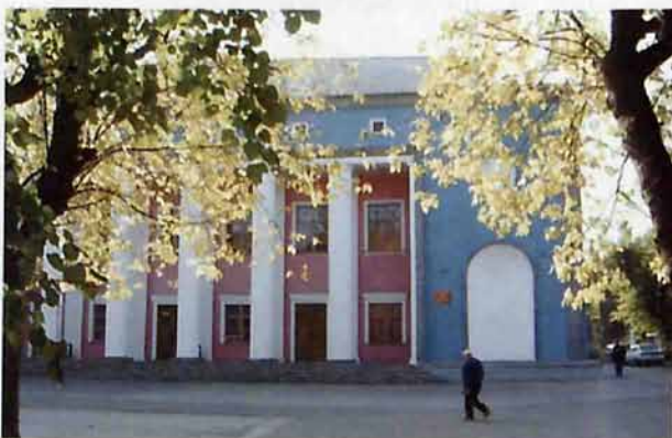
МУК «Городекой дворец культуры»

Строительство Дворца культуры (ныне городекой ДК), красивей-