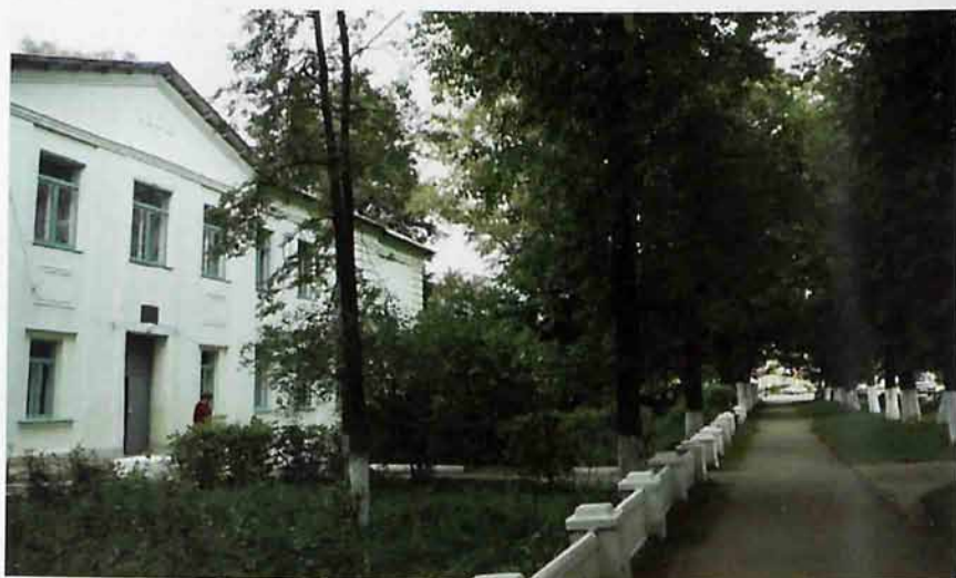
Центр внешкольной работы мкр-на Сокольники

На 1 января 1953г. в выстроенном поселке для шахтеров угольной промышленности Мосбасса проживало уже около 8 тысяч населения, были построены школа, детский сад, баня, столовая, магазин, амбулатория.