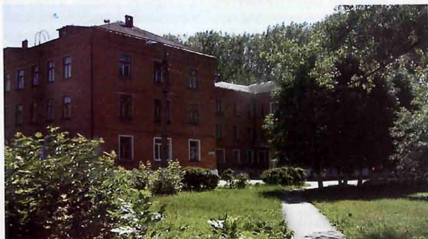
МУЗ «Сокольническая городская больница»

Указом Президиума Верховного Совета РСФСР 1 апреля 1954г. населенный пункт Сокольники Гремячевского района Московской области отнесен к категории рабочих поселков.