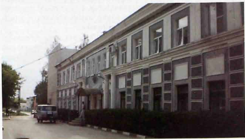
здание «УВД по городу Новомосковску» на ул. Дзержинского

деятеля Дзержинского Феликса Эдмундовича (1877 - 1926гг.), который вошел в историю нашей страны в образе «железного Феликса».