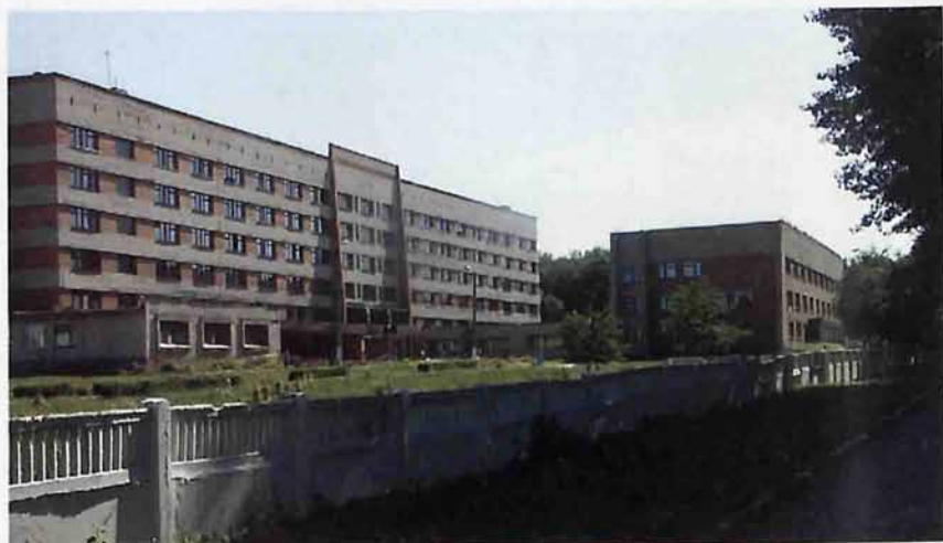
МУЗ «Детская городская больница»

С правой стороны шоссе располагается многопрофильная Детская городская больница (открыта в 1991 году), с левой стороны – корпуса многоэтажных жилых домов и объекты социально-бытового назначения (супермаркет «СПАР», «Эльдорадо», мебельный салон «Милан» и современная химчистка «Vela»).