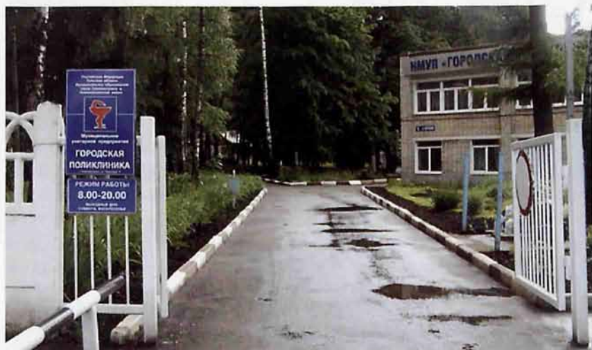
НМУП «Городская поликлиника»

В решении Новомосковского горисполкома № 1282 от 23 декабря 1971 года содержится следующее: «в связи со строительством домов в районе Залесного микрорайона, присвоено наименование улице, идущей вдоль восточной границы лесопарка – Парковая». На улице расположены объекты здравоохранения и социально-бытового обслуживания.