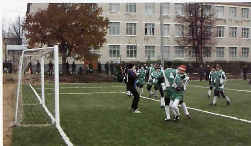
Стадион МОУ «СОШ № 9»

Свое название улица получила в память об известном поэте, одном из представителей авангардного искусства 1910 – 1920-х гг. – Владимире Маяковском (1893 - 1930гг.)