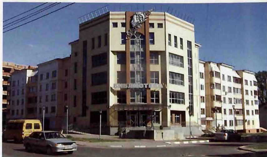
здание центральной библиотеки МУК «Новомосковской городской библиотечной системы»

На доме № 30/29 установлена мемориальная доска в память о Степане Васильевиче Садовском.