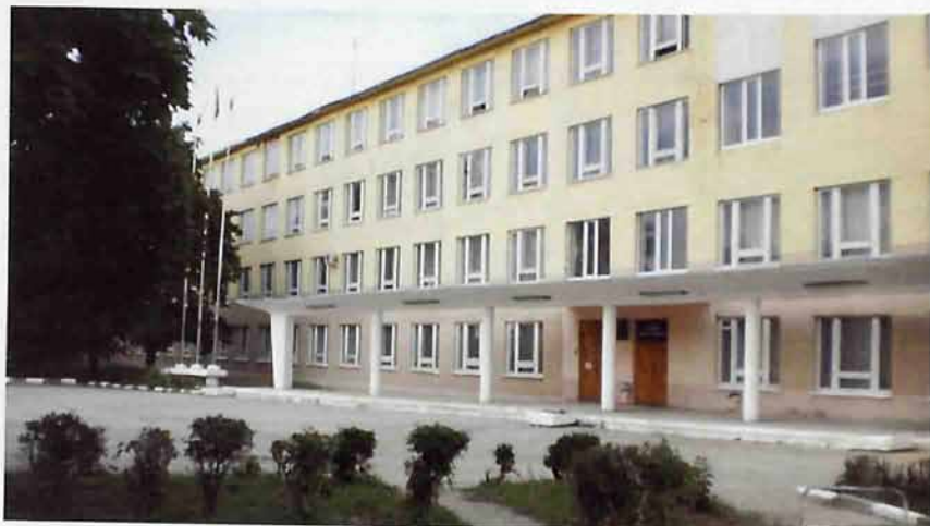
Здание НИ РХТУ им. Менделеева (новый корпус)

В 1972 году введен в эксплуатацию новый учебный корпус Новомосковского филиала МХТИ им.Д.И.Менделеева (в настоящее время РХТУ).