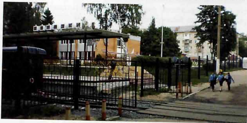
Детская железная дорога, станция Березки, 2010 г.

Указом Президиума Верховного Совета СССР от 28 мая 1966 года за выдающиеся заслуги в выполнении заданий семилетнего плана по увеличению выпуска химической продукции и достижение высоких