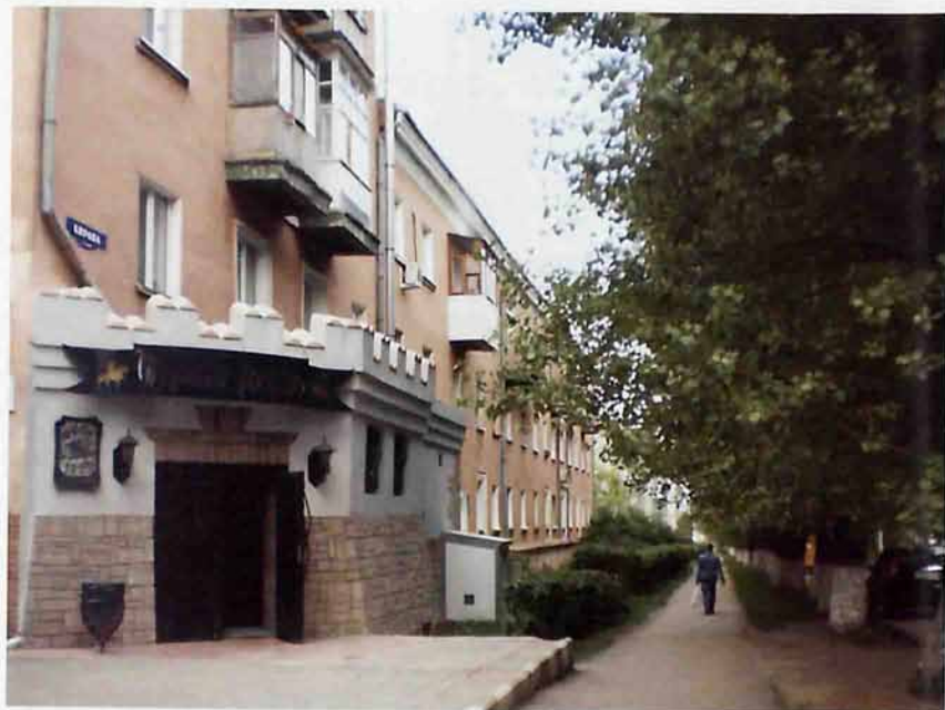
Ресторан «Черный рыцарь» на ул. Кирова

Улица названа в честь советского государственного и партийного деятеля Кирова Сергея Мироновича (1886 - 1934гг.)