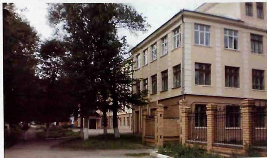
МОУ «Гимназия № 13»

Улица названа именем советского партийного и государственного деятеля Свердлова Якова Михайловича (1885 – 1919гг.)