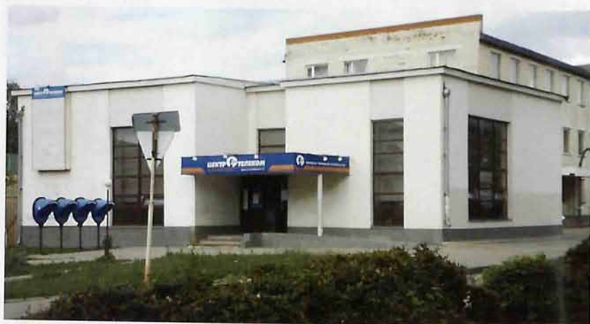
здание ОАО «Центр Телеком»

Улица названа именем советского государственного, партийного