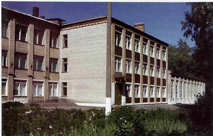
МОУ «Сокольническая СОШ № 2» на ул. Пушкина

Протоколом № 18 исполкома Сокольнического городского Совета депутатов трудящихся Сталиногорского района Тульской области от 24 октября 1958г. улице, проходящей с восточной стороны 41 квартала г.Сокольники, присвоено наименование – улица Садовая.