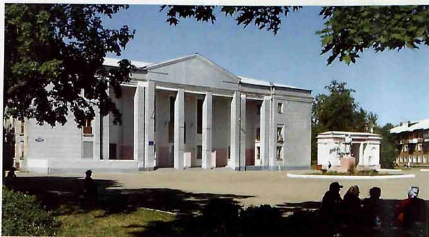
МУК «Дом культуры мкр. Сокольники»

В соответствии с Законом Тульской области от 24 октября 2008г. № 1102-ЗТО «Об объединении поселений, входящих в состав территории муниципального образования Новомосковский район, с муниципальным образованием город Новомосковск Новомосковского района, о внесении изменений в закон Тульской области «О преобразовании муниципального образования город Новомосковск Новомосковского района, установлении границы муниципального образования город Новомосковск Новомосковского района» и о признании утратившими силу отдельных законодательных актов Тульской области» муниципальное образование город Сокольники Новомосковского района утратило статус муниципального образования. МО город Новомосковск Новомосковского района.