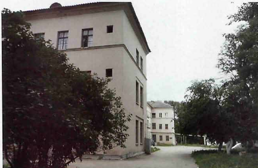
МУЗ «Медико-санитарная часть им. Барского И.П.»

промышленной части города. На ней находится одно из старейших учреждений здравоохранения МУЗ «Медико-санитарная часть им. Барского И.П.», следственный изолятор № 4 (учреждение ИЗ-71/4), заводоуправление ЭЦМ, МОУ «СОШ № 10».