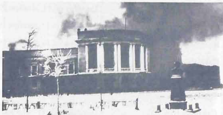
Горящее здание Сталиногорского горисполкома