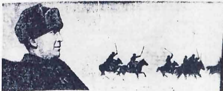
Декабрь 1941 г., Сталиногорское направление Генерал-майор Белов П.А.

которое занято было нами без потерь. Я забежал в свою хату, хотел увидеть семью, ребят. Грязь и запустение, груды хлама и соломы... Семья укрылась во время боя в колхозном хранилище. Рядом был Сталиногорск. Наступление на него велось в двух направлениях: с Иван-Озера через д. Малое Колодезное и с шахты № 22 через д. Урванку» (газета «Сталиногорская правда» за 1942 г.)