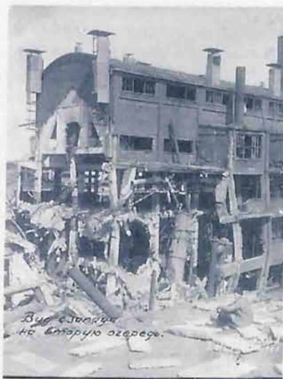
1942 год Восстановление химкомбината Газовый цех

Восстановительные работы на химкомбинате велись днем и ночью. Нужно было как можно быстрее возродить производство метанола, производство пороха, моторного топлива. Все это необходимо было фронту. Во многих цехах оставались лишь фундаменты. Строительных материалов не хватало. Для работ приспособляли ручные лебедки и трактора. Строповали тросами глыбы и исковерканные металлоконструкции. Основные усилия были направлены на восстановление цеха метанола.