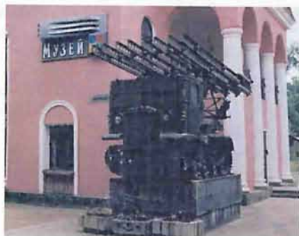
«Катюша» до и после реставрации