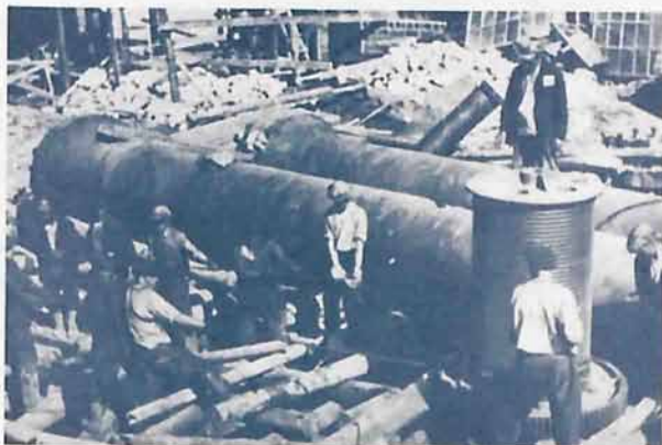
1942 год Восстановление химкомбината Газовый цех Разгрузка оборудования