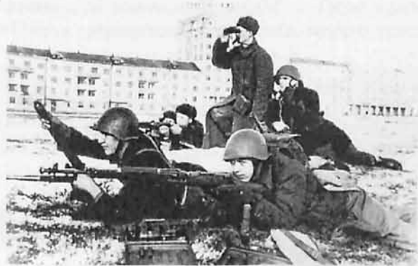
Декабрь 1941г., г.Сталиногорск Бойцы минометной батареи

лишить врага возможности отойти самому с техникой. И под шквальным огнем враг отступал все дальше на Запад, устилая своими трупами заснеженные поля.»