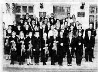
Симфонический оркестр, 1998 г.