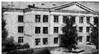
Невазюковская, 1975. Музыкальное училище. Так оно выглядело на почтовых открытках.