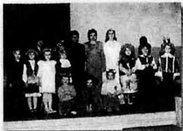
Новосозданная музыкальная школа для детей