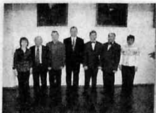
Преподаватели ПЦК "Духовые инструменты"