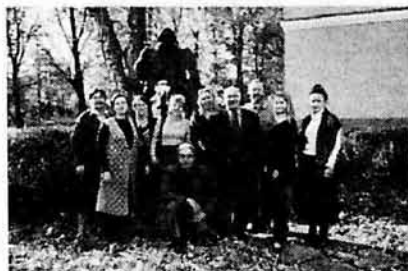
Преподаватели отдела 2008 г.