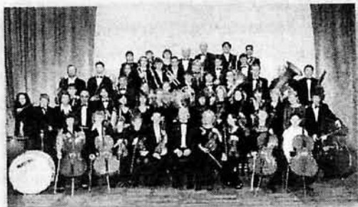
Симфонический оркестр, 2008 г.