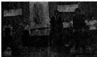
Литературно-музыкальная композиция на русском языке, посвященная 32 годовщине Победы в Великой Отечественной войне, подготовленная в английском языке под руководством преподавателя С.М.Обухова.