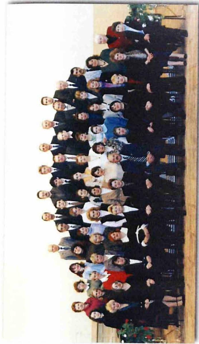
Коллектив Новомосковского кружкового училища, 1998 г.