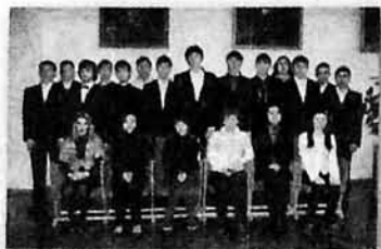
Студенты ПЦК "Духовые инструменты"