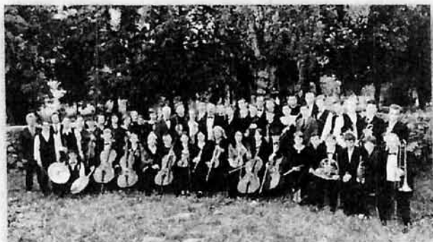
Симфонический оркестр, 2004 г.