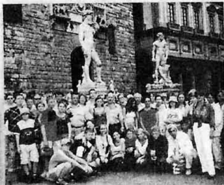
Оркестр у памятника "Давиду", г. Флоренция (Италия), 2002 г.