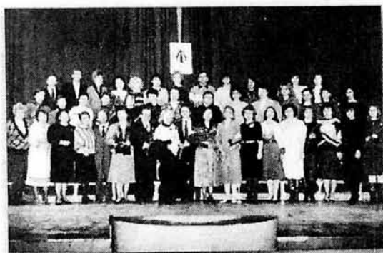
Творческая встреча дизайнерско-хорового отдела с бывшими участниками НМУ