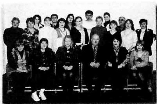
Коллектив специальной музыкальной школы №46, 2009 г.