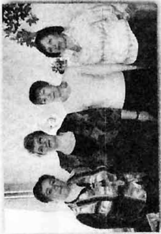
Коллектив бурластроя. 2009 г.