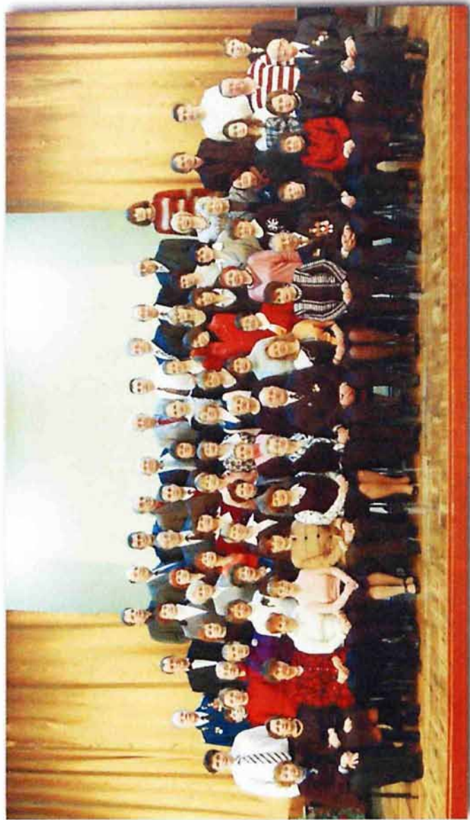
Коллектив Новосибирского мусульманского сообщества, 2009 г.