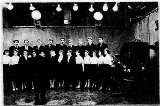
Запись выступления хора НМУ на телевидении