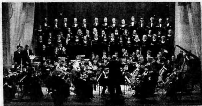
К. Орф "Кармина Бурана". Тульская областная филармония. Новомосковский симфонический оркестр с хором Тульской филармонии, 2005 г.