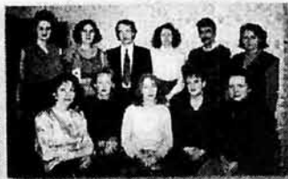
Преподаватели отдела ОКФ