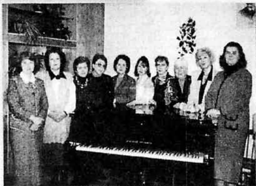
Предметно-методическая комиссия "Фортепиано", 1996 г.