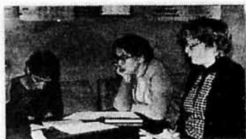
Деловая игра предметной комиссии ОКФ