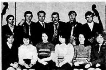
Класс пианистели и контрабаса, 1973 г.