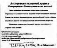
Поздравление с открытием III Международного конкурса от Ассоциации камерной музыки Международного Союза музыкальных деятелей