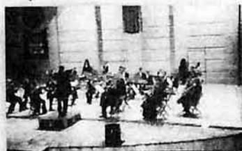
Концерт в "Амфитеатре", г. Валенсия (Испания), 2004 г.