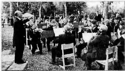
Куликово поле, 2005 г.