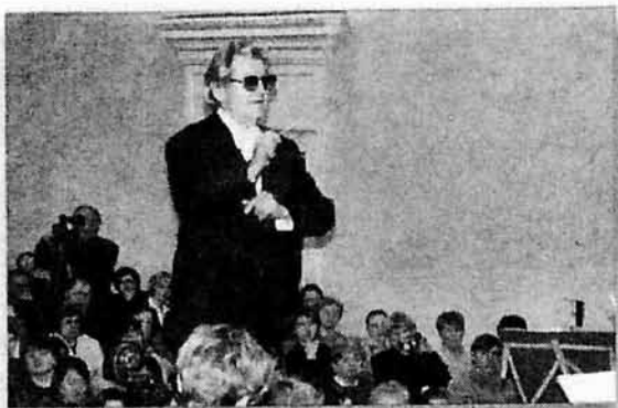
Маэстро, заслуженный деятель искусств РФ Фуат Шакирович Мансуров с Новомосковским симфоническим оркестром. А. Хачатурян "Валенсанская вдова", 2005 г.