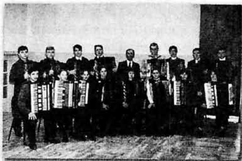
Дирижер В.И. Чесаков с оркестром баянистов, 2002 г.