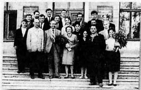
Первый выпуск отдела народных инструментов, 1963 г.