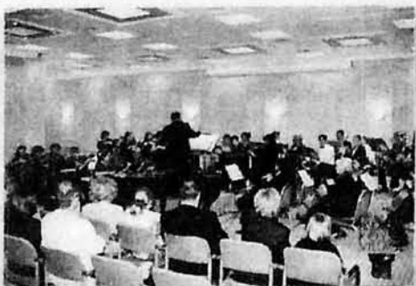
Открытие концертного зала в г. Ираклион (Греция), 1998 г.