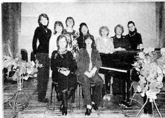
Предметно-методическая комиссия "Фортепиано", 2009 г.