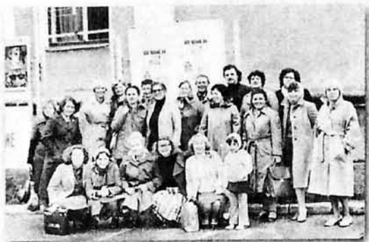
Поездка в хоровую студию "Огонек" г. Ступино